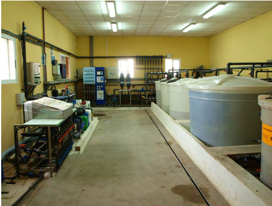
Cabezal de riego