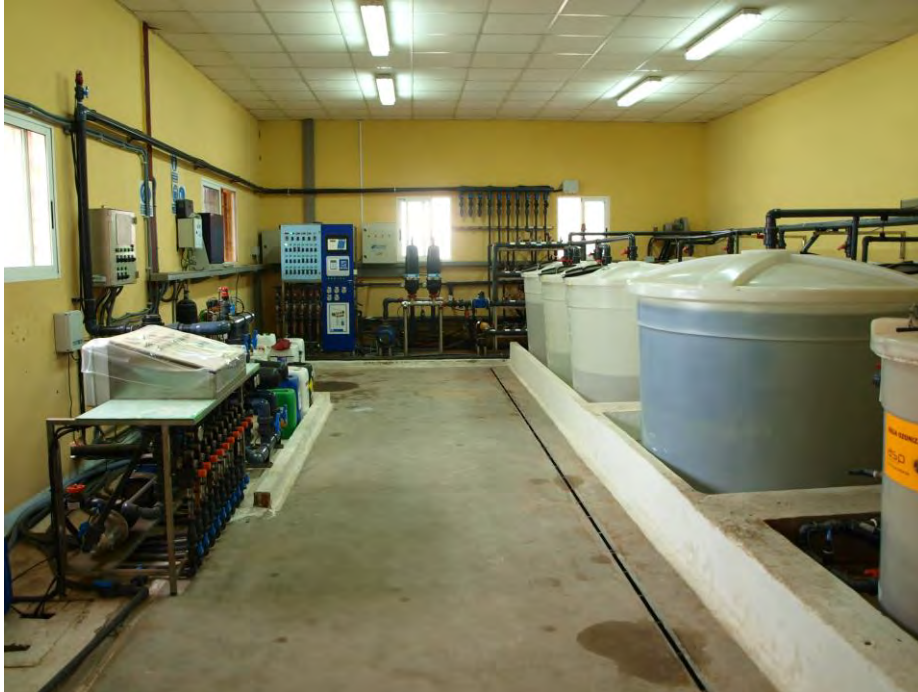
Cabezal de riego