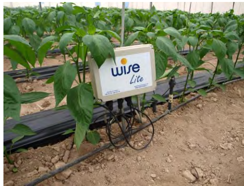
Sensores de alta precisión para invernadero