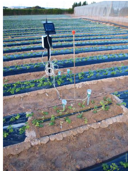
Sensores alta precisión para cultivos aire libre