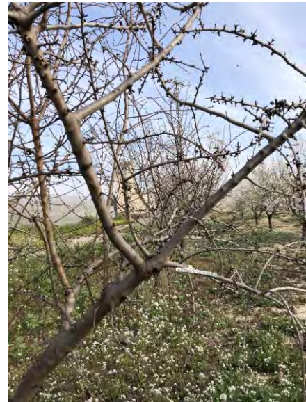
Variedad Antoñeta- Estado fenológico E