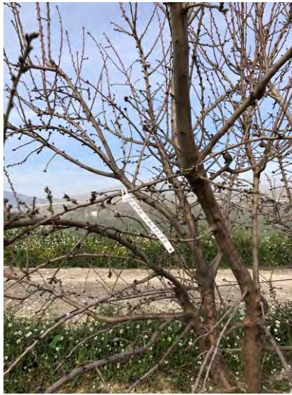
Varietal Penta – estado fenológico D