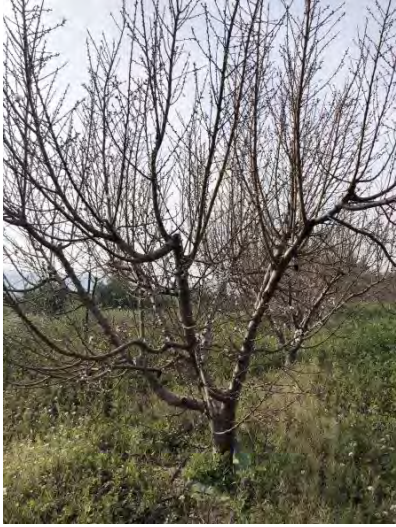
Variedad Garrigues- estado fenológico F