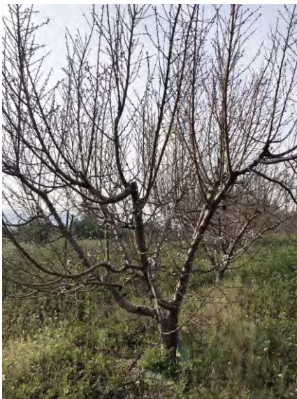
Variedad Siroco 10. Estado fenológico F

En la parcela 4 tenemos una colección de variedades de Paraguayo, Siroco 10, Samantha, UFO-4, Carioca, Roblecillo, Flatstar, Flat Chef y Flat Julie. Solo la variedad Siroco se encuentra en floración