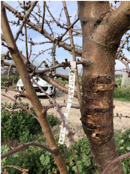
Variedad Constantí. Estado fenológico E