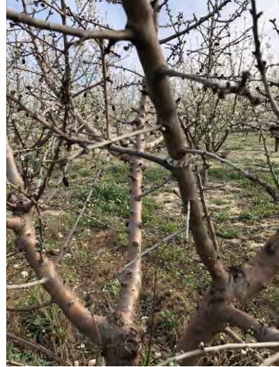
Variedad Tarraco – Estado fenológico F