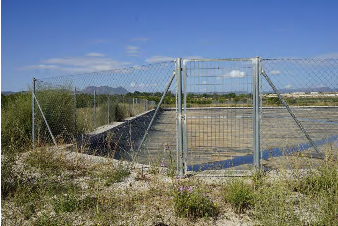
Embalse de riego Las Nogueras cubierto.