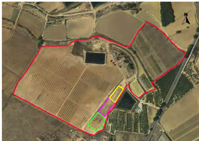
Ubicación de los cerezos.

La superficie de la parcela demostrativa dentro del proyecto es de 0,60 ha.