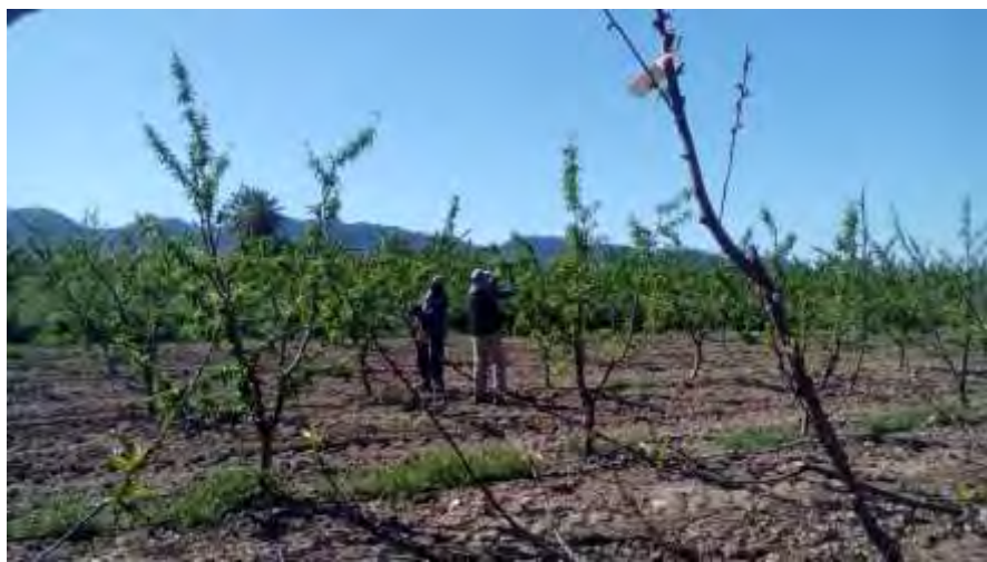
Operarios realizando la labor de aclareo en la parcela e demostración

El aclareo de fruta en los melocotoneros se realizó en el mes de abril. Se confirma que algunas variedades, tales como los procedentes de Canarias CA 85109, CA85110 y el ALG 12 de Granada, no es necesaria la labor, ya que se aclaran solos, cuestión de gran importancia ya que supone un gasto muy importante en la cuenta de resultado en el cultivo del melocotón.