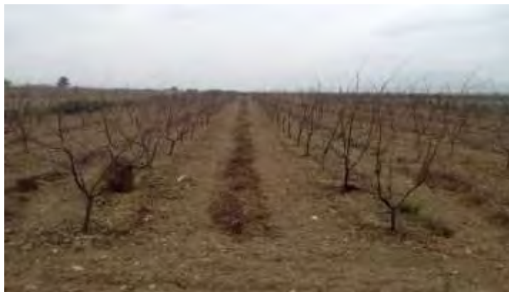
Resto de poda acordonados para su incorporación al suelo

La poda se realizó a principios del mes de marzo a yema hinchada. El sistema de poda es en vaso libre el albaricoquero y melocotonero. En los cultivares de manzano y peral, por falta de espacio entre árboles, se forman en eje central. Los restos de poda se incorporaron al suelo mediante trituración de la misma.