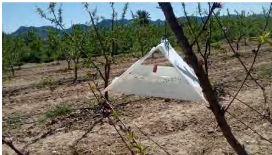
Trampa tipo delta con base pegajosa y feromona para monitoreo de orugas barrenadoras

Por el contrario, en las observaciones realizadas en las épocas de 2ª y 3ª generación y los conteos en la en las trampas de monitoreo, no se obtuvo ninguna captura, por lo que la efectividad de método, al menos para este año, se consideró muy eficaz.