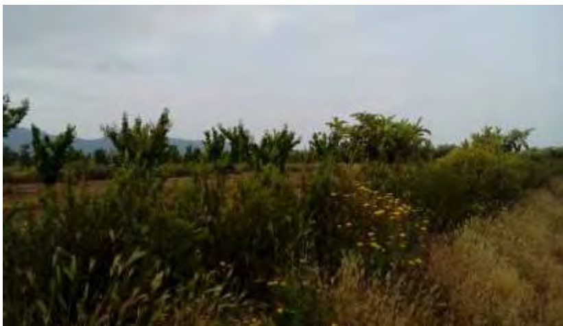
Detalle del seto perimetral de la parcela demostrativa en el presente año

A principio de febrero de 2015 se planta un seto perimetral de especies forestales en la parcela demostrativa al objeto de aumentar la biodiversidad funcional. La distancia entre plantas del seto es de 1 m y se dispusieron de las siguientes especies: Mirto comunis , Pistacia lentisco , Juniperus oxicedrus , Phyllirea angustifolia , Rhamnus alaternus , Anagyris foetida , Abutus unedo , Cistus albidus , C. clusi , Halimium atripicifloium , Neruim oleander , Quercus coccifera , Lonicera Implexa y Cyhameropus humilis .