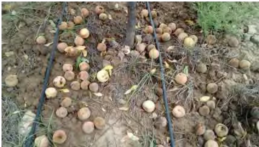
Detalle de la pérdida de cosecha motivado por la Dana de septiembre de 2019

Como comentábamos líneas atrás, el temporal del 11 al 14 de septiembre tiró casi toda la fruta que estaba pendiente de recolectar en la parcela de demostración y la poca que quedó en los árboles se perdió por el efecto de la mosca de la fruta, ya que no se consideró rentable su protección al ser muy poca su cantidad.