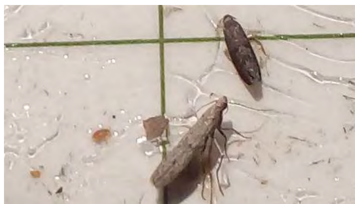
Detalle de Grafolita (arriba) y Anarsia (abajo) capturadas (19-7) en trampa con base pegajosa cebada con feromona de anarsia.

El 11 de julio una vez transcurridos 15 días del máximo de la curva de vuelo de Grafolita y tras hacer observaciones y comprobar exudaciones gomosas en algunos frutos, y al haberse rebasado también el umbral de tratamiento de la mosca de la fruta ( Ceratitis capitata ), se decide hacer un tratamiento con spinosad con efectividad para ambos fitófagos a toda la parcela.