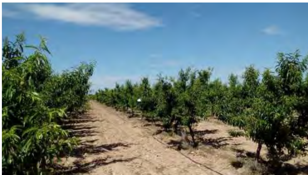
Aspecto de la plantación en junio 2019