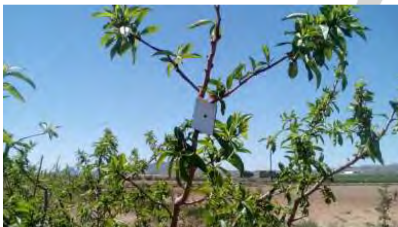
Trampa de confusión sexual contra Anarsia

Contra anarsia, que tantos problemas nos ocasiono el año anterior, para su control se eligió la técnica de la confusión sexual. Se instalaron trampas Checkmate PTB-XL a una dosis de 375 ud/ha. También se dispuso una trampa de monitoreo para comprobar la efectividad del método y comprobar la curva de vuelo del microlepidóptero.