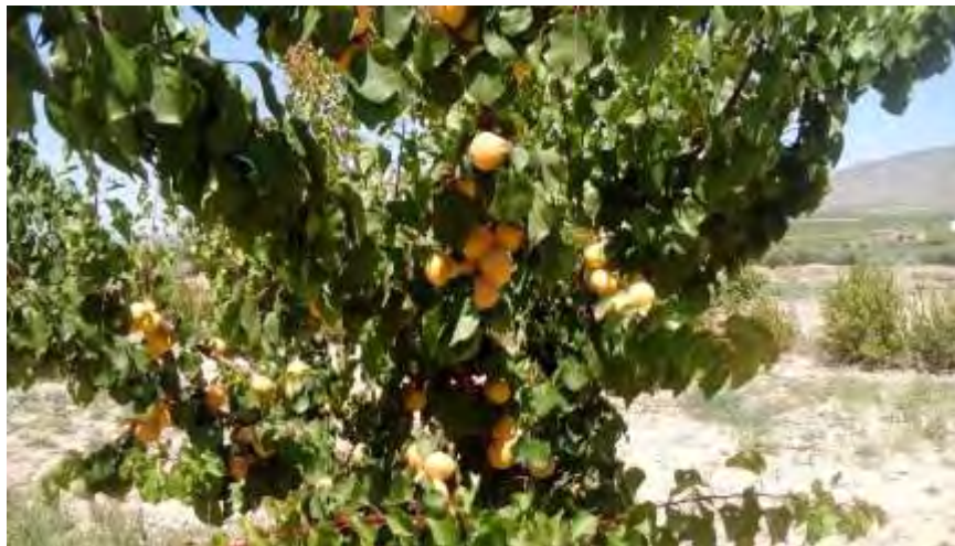
Detalle de fructificación de la variedad Pacorro

En albaricoquero, al menos de momento, no se considera necesaria la labor, ya que el calibre es muy bueno.