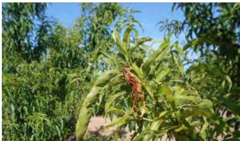
Síntomas de ataque de Anarsia en primera generación

En primera generación (mayo-junio) se capturo algún adulto en las trampas de monitoreo, indicar que en ésta los daños se consideran estéticos y se centran sobre los brotes.