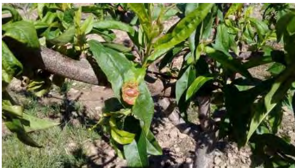
Síntoma anecdótico de lepra o abolladura ( taphrina deformans ) en la parcela de demostración

Por el contrario, la afección de enfermedades fúngicas tales como oídio, lepra o abolladura, cribado etc. han sido testimoniales y aun en condiciones favorables para su desarrollo, como las de este año, pone de manifiesto la resistencia de las variedades locales a este tipo de patógenos, cuestión que no es baladí.