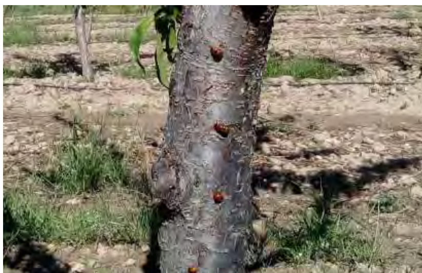
Detalle de la abundancia de Coccinélidos reproduciéndose en la parcela de demostración

Se realizaron cuatro tratamientos contra el pulgón. El primero se realizó el 27 de marzo, el insecticida de elección fue la azadiractina (Neemazal), se decidió por esta sustancia para no interferir en la fauna auxiliar, fundamentalmente coccinélidos, que abundaban en la parcela en esta época. Como era de esperar, el resultado del tratamiento fue insuficiente para el control total de la plaga. El 6 de abril se repitió el tratamiento con la misma sustancia; el ataque por estas fechas era de considerable magnitud con incluso seca de puntas de brotes. Aunque los tratamientos no tuvieron una gran efectividad, sí lograron frenar el avance de la plaga, a pesar que ésta siguió su evolución. Por consiguiente, se realizaron dos tratamientos más con piretrinas naturales, uno el 21 de mayo y otro el 28 del mismo mes, sin que la efectividad resultase total. Con la llegada del calor y tiempo seco, la plaga desapareció de forma natural y los árboles se recuperaron satisfactoriamente.