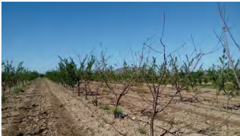
Aspecto de la parcela en abril 2019. Nótese la diferencia de fenología de los cultivares de La Nava (LN1, LN3, LN4; LN5) en relación con el resto

Por el contrario, la afección de enfermedades fúngicas tales como oídio, lepra o abolladura, cribado etc. han sido testimoniales y aun en condiciones favorables para su desarrollo, como las de este año, pone de manifiesto la resistencia de las variedades locales a este tipo de patógenos, cuestión que no es baladí.