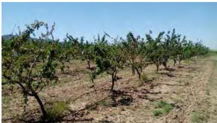
Arboles fuertemente afectados por el ataque de pulgón

Tal como se hizo el año anterior con muy buenos resultados, se proponía dar un tratamiento de parcheo a los primeros focos, acción muy recomendable para el control de la plaga, pero la rápida explosión poblacional del fitófago de forma generalizada por toda la parcela, determino la necesidad de realizarlo a toda la parcela.