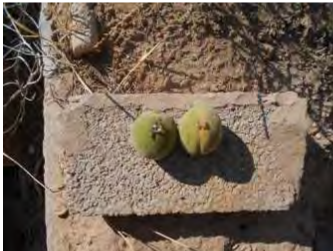
Síntomas de ataque de Grafolita en frutos, la diferencia con anarsia es que ésta realiza las penetraciones por la zona peduncular