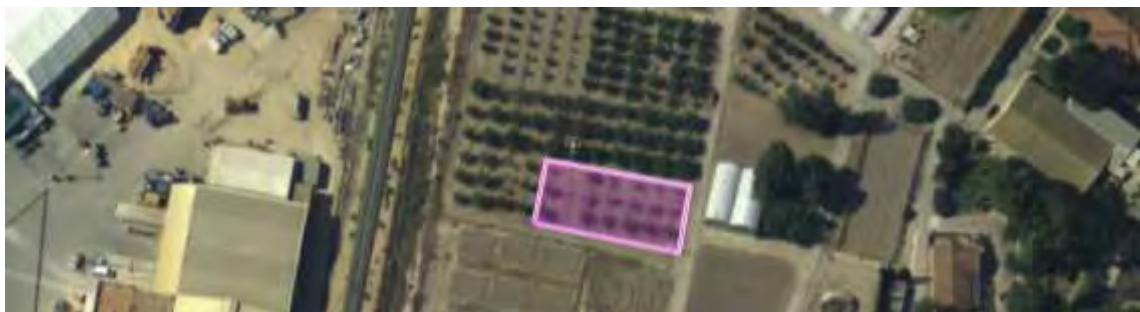
Figura nº1. Ubicación del ensayo de albaricoqueros en el CIFEА de Torre Pacheco