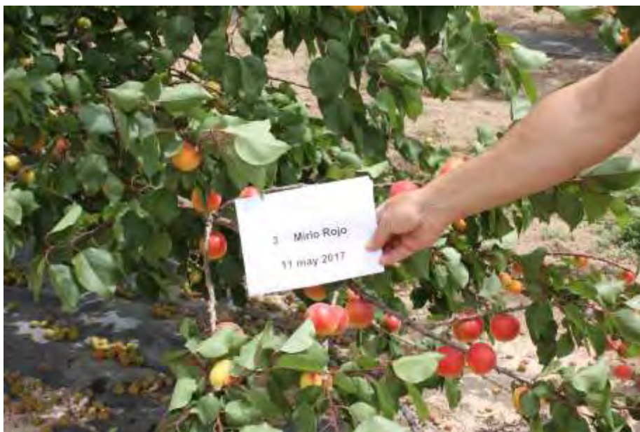
Foto nº 2. Árbol de la variedad Mirlo Rojo antes de su recolección, 11 de mayo de 2017.

Los valores de producción sólo podrán ser tomados como orientativos dado el poco número de árboles del ensayo, y no tener repeticiones.