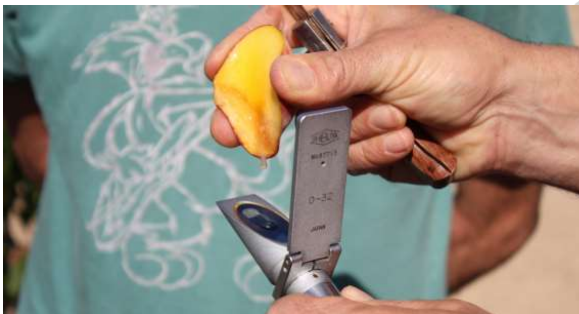
Foto nº1. Medida de los grados Brix en frutos con el refractómetro.

Las labores culturales a realizar son: poda, labor de cultivador y/o fresadora en el centro de las calles, desbrozado en el borde entre la zona de laboreo y la tela cubre suelos, fertirrigación, tratamientos fitosanitarios, recolección y análisis de los datos.