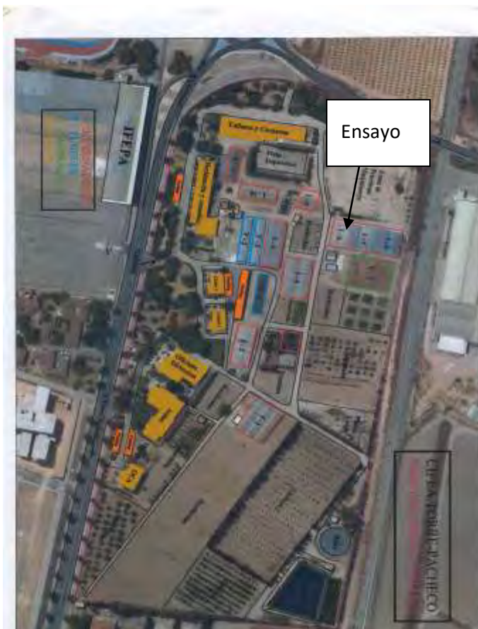
Figura 2: Plano del CIFEPA de Torre Pacheco

La superficie del ensayo será de 240 m 2 .