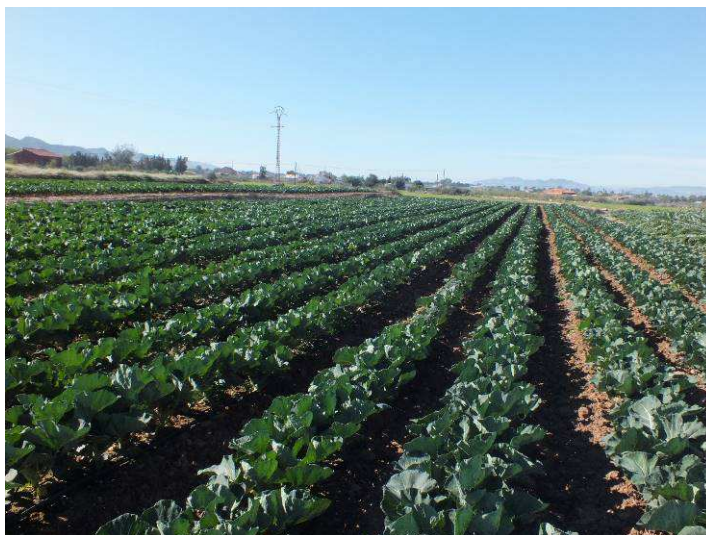
Foto 1. Plantas de Romanesco en el Centro de Demostración