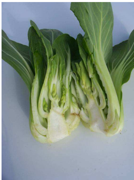
Foto 8. Ejemplar de Pak Choi con subida a flor prematura