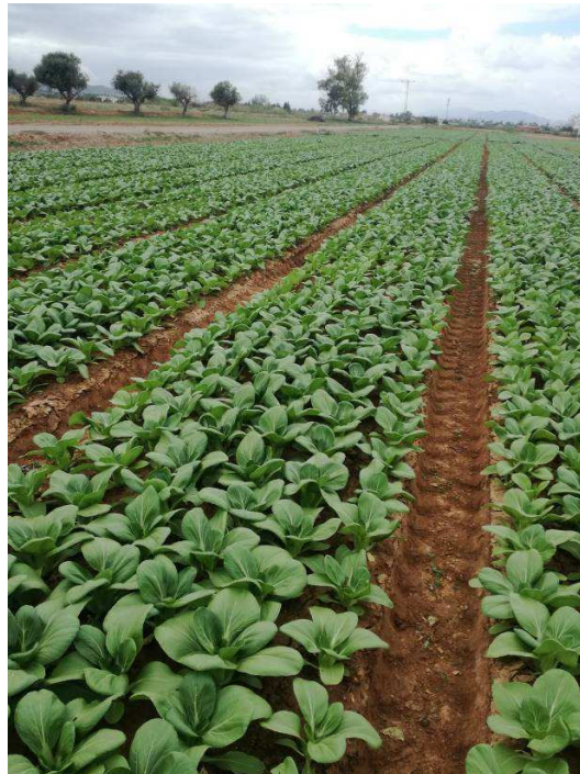
Foto 3 y 4. Plantas de Romanesco Y Pak-Choi en la mesa de cultivo