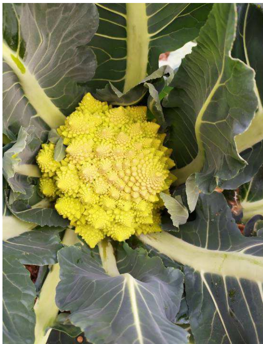
Foto 5. Pella de Romanesco a punto de recolección.