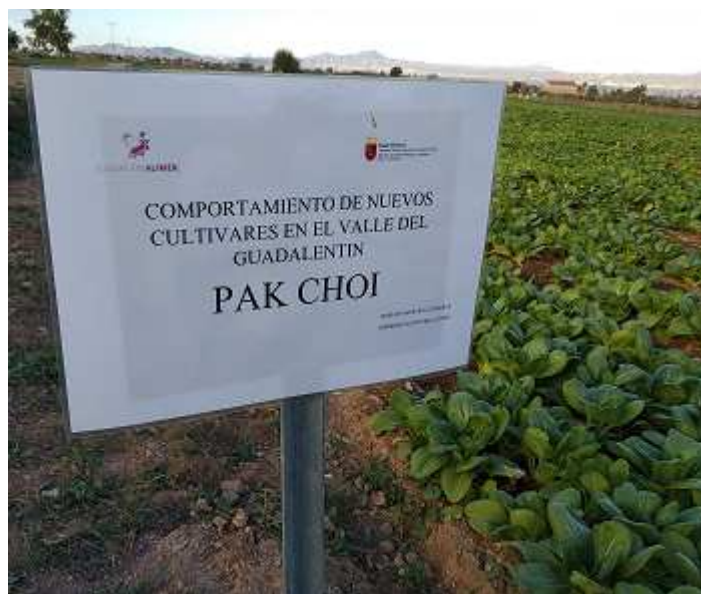
Foto 2. Plantas de Pak Choi en la parcela del Centro de Demostración.