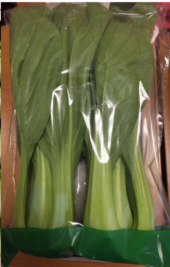
Foto 6. Confección en caja de madera desechable Foto 7. Confección de bolsas de dos piezas de Pak Choi