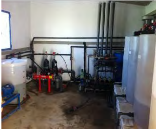
Fig. 2. Detalle del cabezal de riego

El agua de riego es suministrada por la Comunidad de Regantes de Lorca mediante una tubería de presión que surte a la finca de agua del trasvase Tajo-Segura.