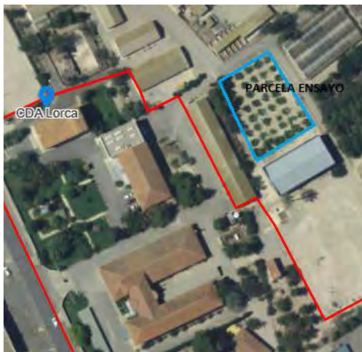
Fig.1. Situación de la parcela