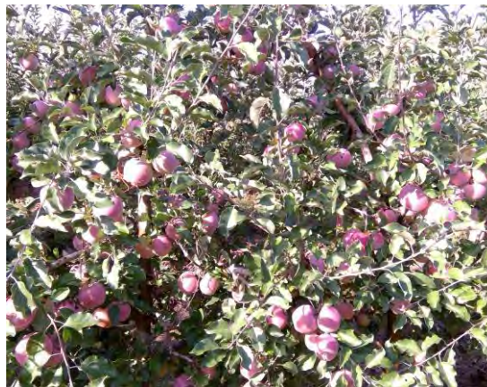
Manzana a la recolección en finca Las Nogueras (2018).

La mayoría de las variedades cultivadas en España corresponden al tipo Golden, seguidas de las del grupo Gala, Red Delicious y de otros como Fuji, Reinetas y Granny Smith. La tendencia en Golden es implantar las más productivas, con buenas características organolépticas y con menos sensibilidad a russetin, en el resto de grupos las nuevas variedades también buscan tener una mejor coloración de la epidermis.