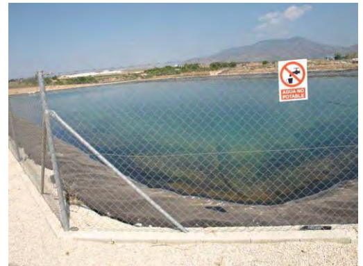
Embalse de riego Las Nogueras.