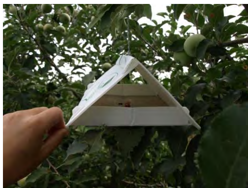
Trampa delta de monitoreo para la carpocapsa..