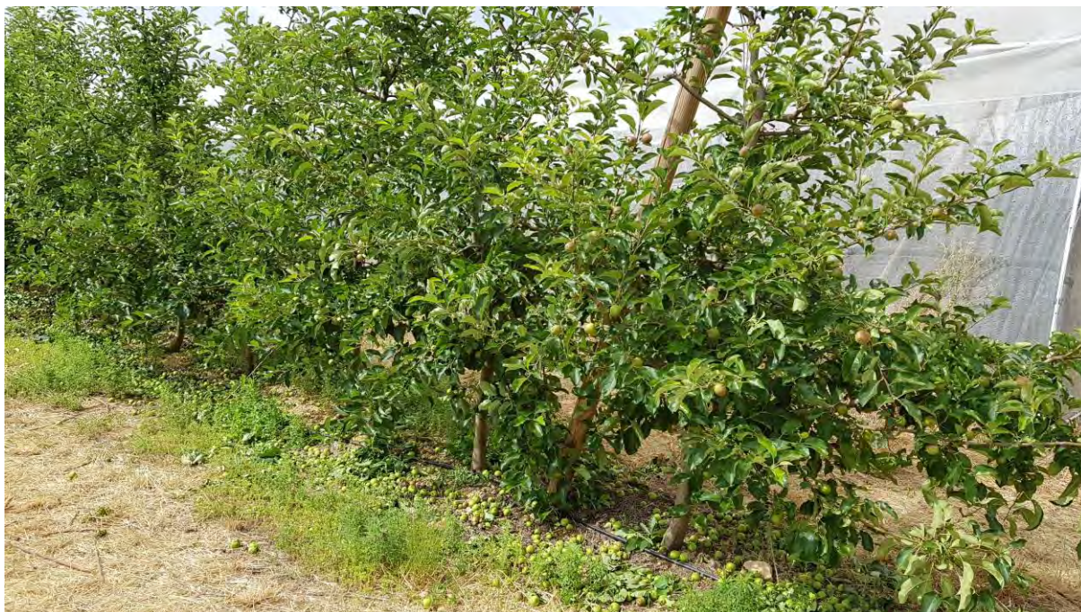
Aclareo de la variedad Brookfield Gala.

El aclareo de fruto se ha realizado a final del mes de mayo. Aunque en las dos variedades minoritarias del grupo Golden se podría hacer un aclareo químico, se realiza en todos de forma manual para que las intervenciones sean homogéneas y comparables. Ello y la recolección suponen un elevado coste dentro de la totalidad de las labores.