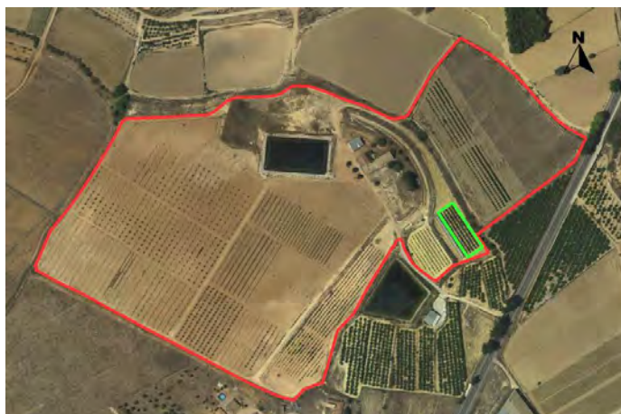
Croquis de ubicación de manzanos CDA Las Nogueras de Arriba.

El proyecto se encuentra situado en una pequeña parcela con coordenadas UTM-Huso 30 (ETRS-89); 596.044/4.210.808 ubicada en el CDA Las Nogueras de Arriba, propiedad de la Comunidad Autónoma de la Región de Murcia, catastralmente en las parcelas 385 del polígono 129 en el paraje Los Prados, T.M de Caravaca de la Cruz.