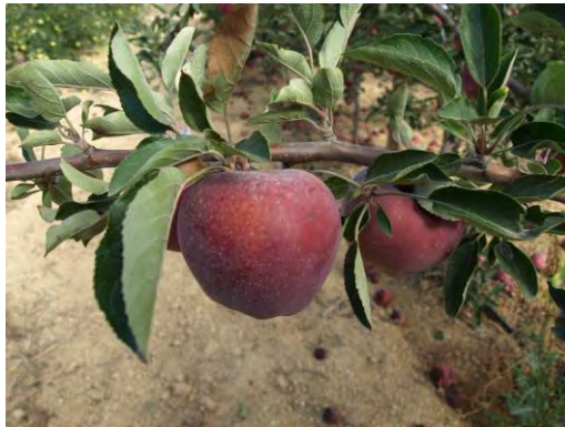
Producción de manzana.

El manzano es un frutal de pepita de la familia de las Rosaceae, genero Malus, la mayoría de las variedades cultivadas corresponde a “ Malus x domestica Burkh”. Es un árbol caducifolio cuyo fruto es un pomo de color variable y forma esférica. Especie de clima templado, requiere frío invernal, poco sensible a calores estivales elevados, exigente en agua, no muy exigente en suelo y de raíces superficiales. En muchos casos autoestéril, necesita la ayuda de otra variedad polinizadora y del concurso de las abejas.