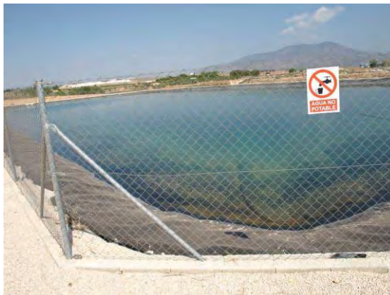
Embalse de riego Las Nogueras.