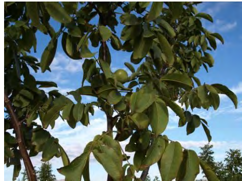
Nogales en Finca las Nogueras (2018).

Las nueces disfrutan actualmente un alto precio en el mercado español, siendo una alternativa de cultivo para muchas zonas de España lo que ha motivado la aparición de nuevas fincas en riego localizado, siendo una clara y real alternativa para el Noroeste de la Región de Murcia, una comarca donde ya se localizan las mayores superficies regionales.