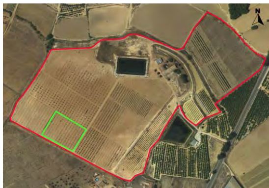
Croquis de ubicación de la parcela pistachos en el CDA La Nogueras.

Se trata de una pequeña parcela con coordenadas UTM-Huso 30 (ETRS-89) ubicada en la finca denominada Las Nogueras de Arriba, propiedad de la Comunidad Autónoma de la Región de Murcia, situada catastralmente en la parcela 385 del polígono 129 en el paraje Los Prados, Caravaca de la Cruz, según el croquis de ortofoto: