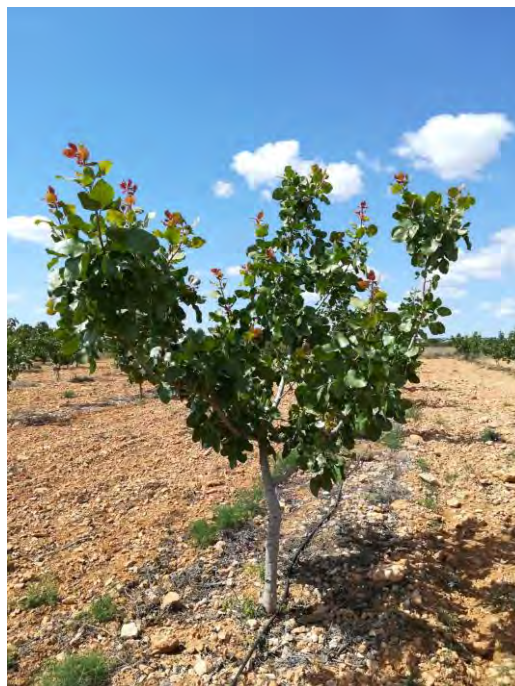
Parcela demostrativa de variedades y patrones de pistacho en CDA "Las Nogueras" (2018).

A través de las actividades de divulgación recogidas en el punto tres de esta memoria inicial de proyecto, serán los beneficiados finales de este proyecto las personas del sector agrario, alimentario y forestal. Dicho proyecto se ejecutará por medio de los Centros Integrados de Formación Agraria y las Oficinas Comarcales Agrarias de la Consejería de Agua, Agricultura, Ganadería, Pesca y Medio Ambiente.