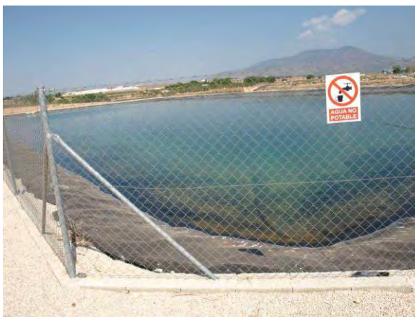
Embalse de riego CDA Las Nogueras.