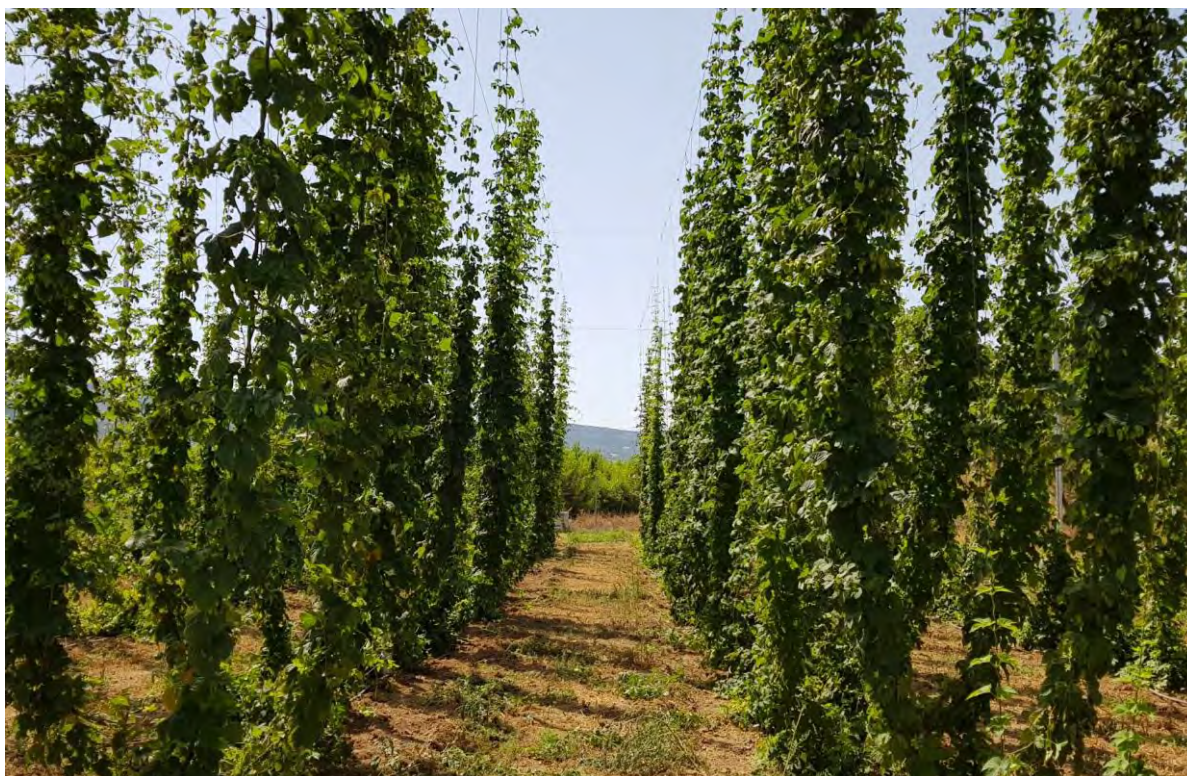
Cultivo del lúpulo en su 2º año (CDA Las Nogueras de Arriba, Caravaca).