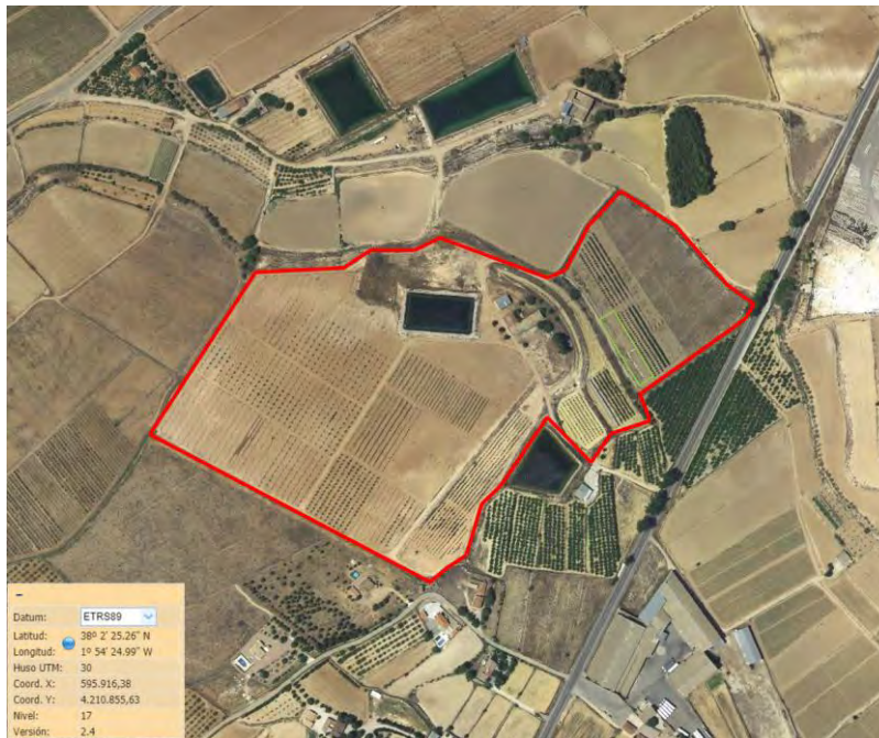
Croquis de ubicación de la parcela de lúpulo en el CDA La Nogueras de Arriba.