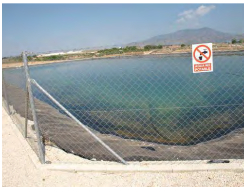
Embalse de riego Las Nogueras.