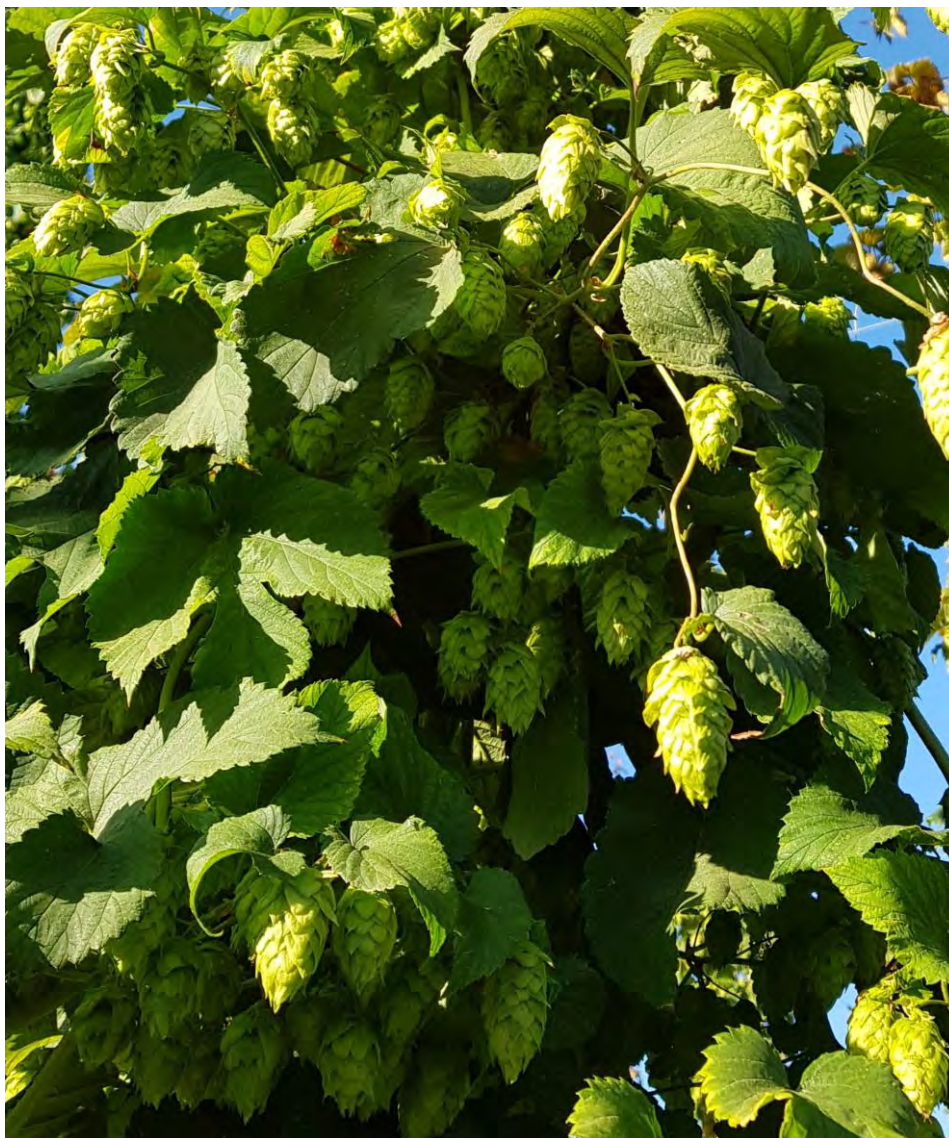
Flores femeninas (conos) de Nugget de 2º año en el CDA Las Nogueras.

La vida media de las plantaciones ronda los 25 años. En su primer año suelen formar un sistema radicular que les permita iniciar su producción en el año siguiente y a partir del tercer año acercarse a la producción máxima de conos.