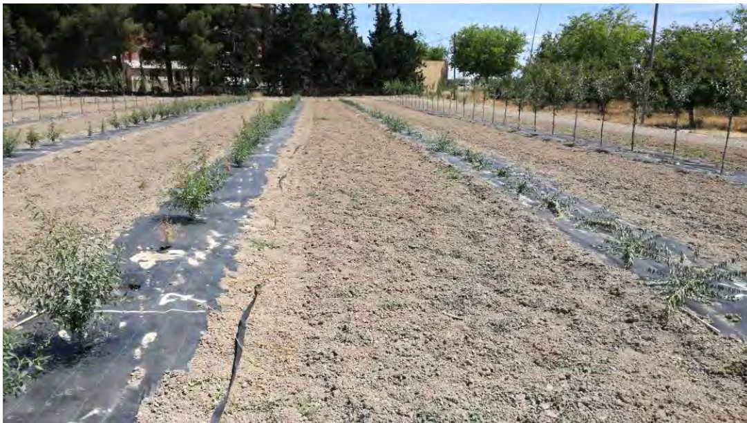
Foto nº 1. Detalle de fila de la derecha decapitada una semana después del injerto (15/05/2017) y estado de las plantas germinada que se deja en siembra directa.

Dado que en el ensayo del vivero la variedad 'Vairo' no ha dado buen resultado, con un número de marras en la nascencia superiores a las otras almendras, se sustituyen para la siembra de 2017 por la variedad 'Antoñeta'.