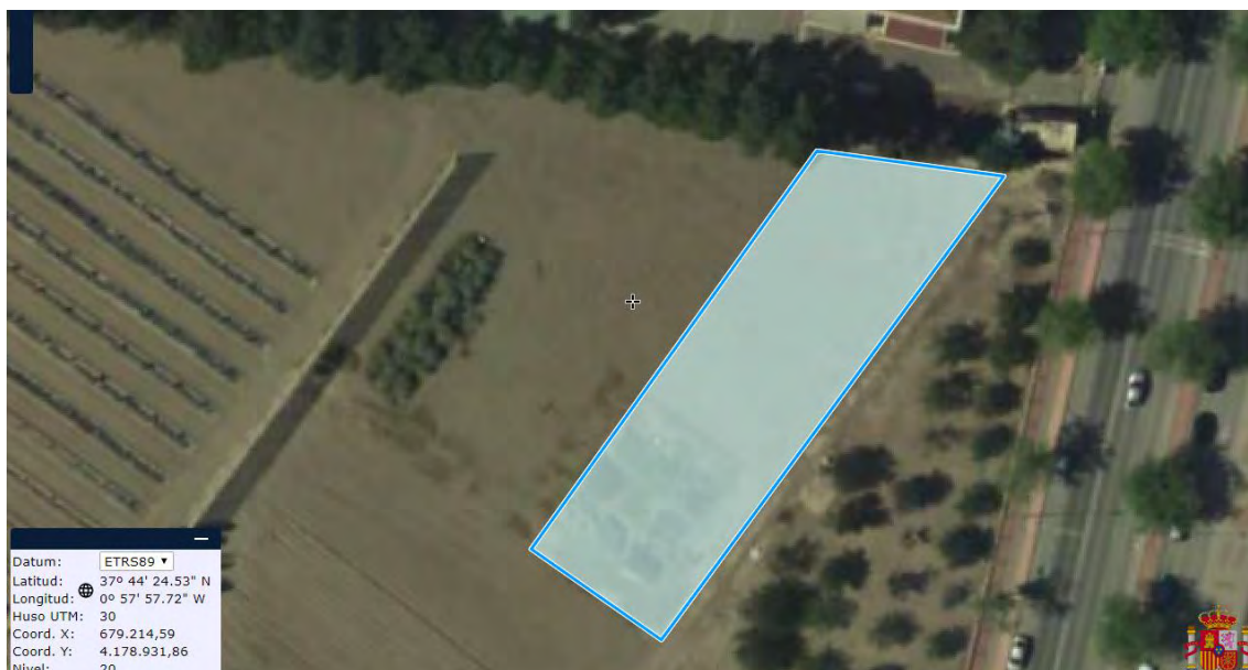
Figura nº 1. Ubicación de la parcela objeto del ensayo de patrones en siembra directa.