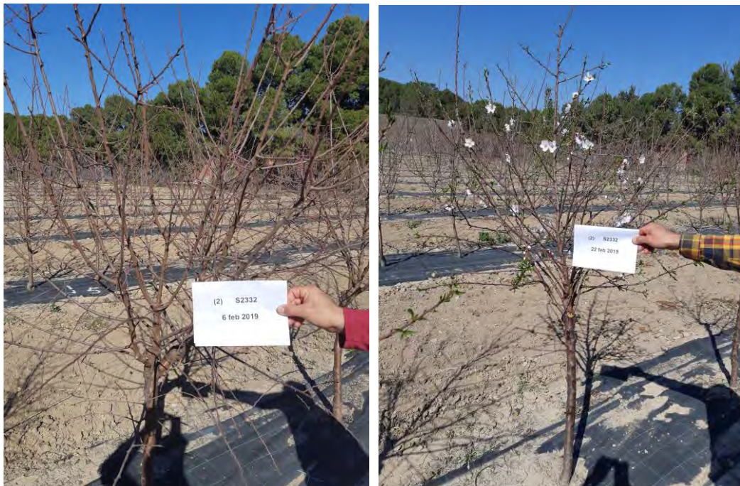
Fotos nº 9 y10. Floración de la variedad `Constantí` sobre patrón `Constantí` en siembra directa el 06/02/2019 y el 22/02/2019.