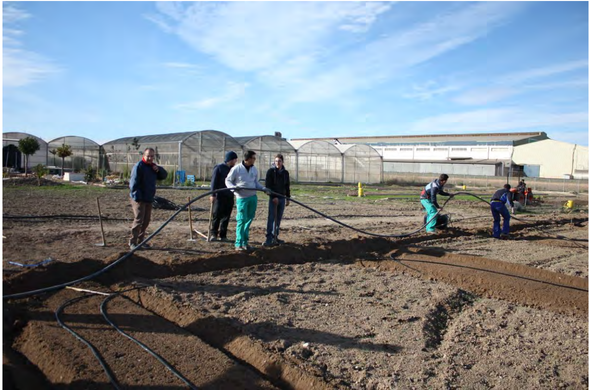
Foto nº 4. Aspecto de la instalación de riego para la plantación de almendros en febrero de 2017.

Después de su activación en el invernadero por medio de humedad y temperatura y una vez germinadas, como se dijo, se siembran dos o tres almendras por cada hoyo y posteriormente se aclarean para dejar la planta más desarrollada, lo que constituye el fundamento de la siembra directa.