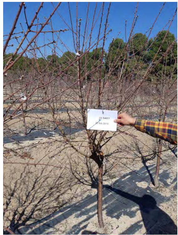
Fotos nº 11 y 12. Floración de la variedad `Constantí` sobre patrón `Vairo` en siembra directa el 06/02/2019 y el 22/02/2019.