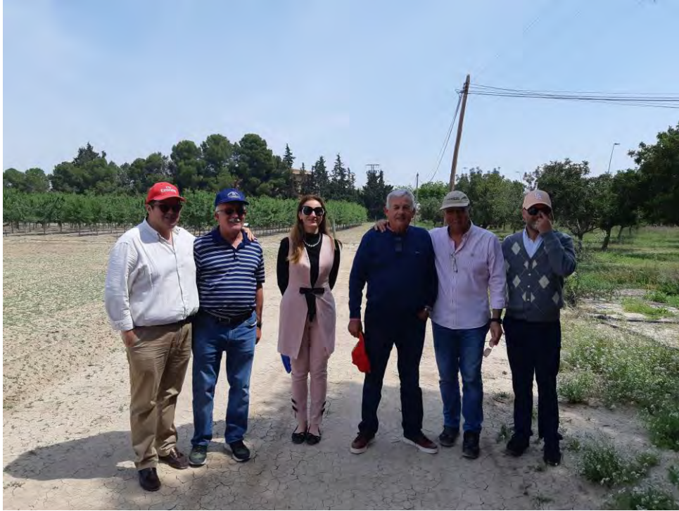
Foto nº 10. Visita técnicos del CEBAS y agricultores (07/05/2019).

En mayo de 2019 se difundió el ensayo en TV 7, ofreciendo la noticia como un cultivo alternativo con menor gasto de agua y nitrógeno y viable en agricultura ecológica.