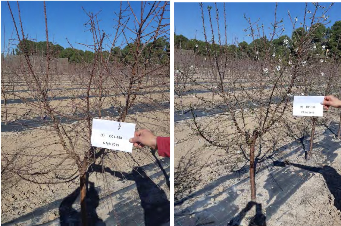
Fotos nº 7 y 8. Floración de la variedad `Constantí` sobre patrón `Marinada` en siembra directa el 06/02/2019 y el 22/02/2019.