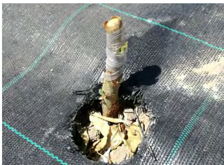
Foto nº 2. Detalle de árbol injertado, 15 de mayo de 2017.