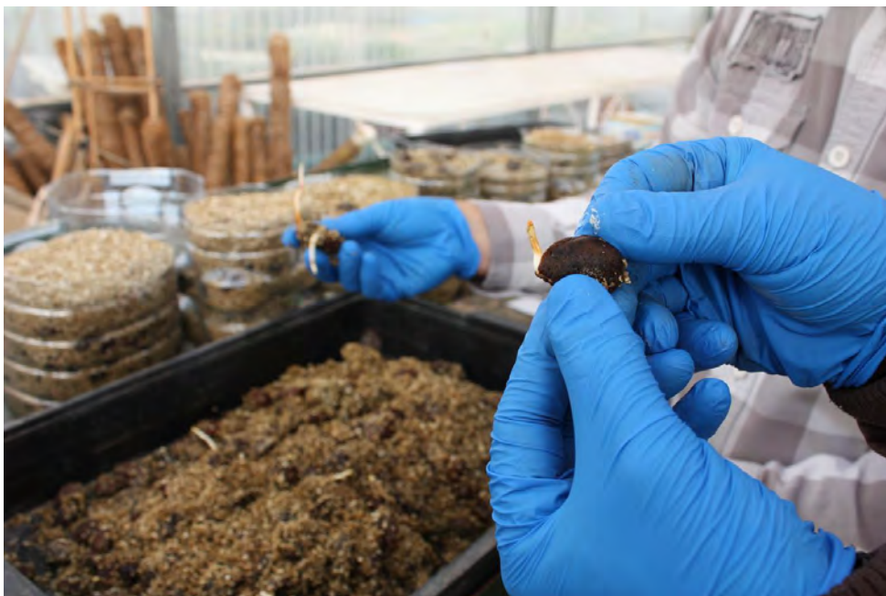
Foto nº 3. Detalle de la emisión de la radícula tras el estratificado en frío (noviembre 2016).

Noviembre 2016: estratificado en frío a 4 grados con sustrato de vermiculita humedecido, hasta que se produce la apertura de la almendra y comienza a emitirse la radícula.