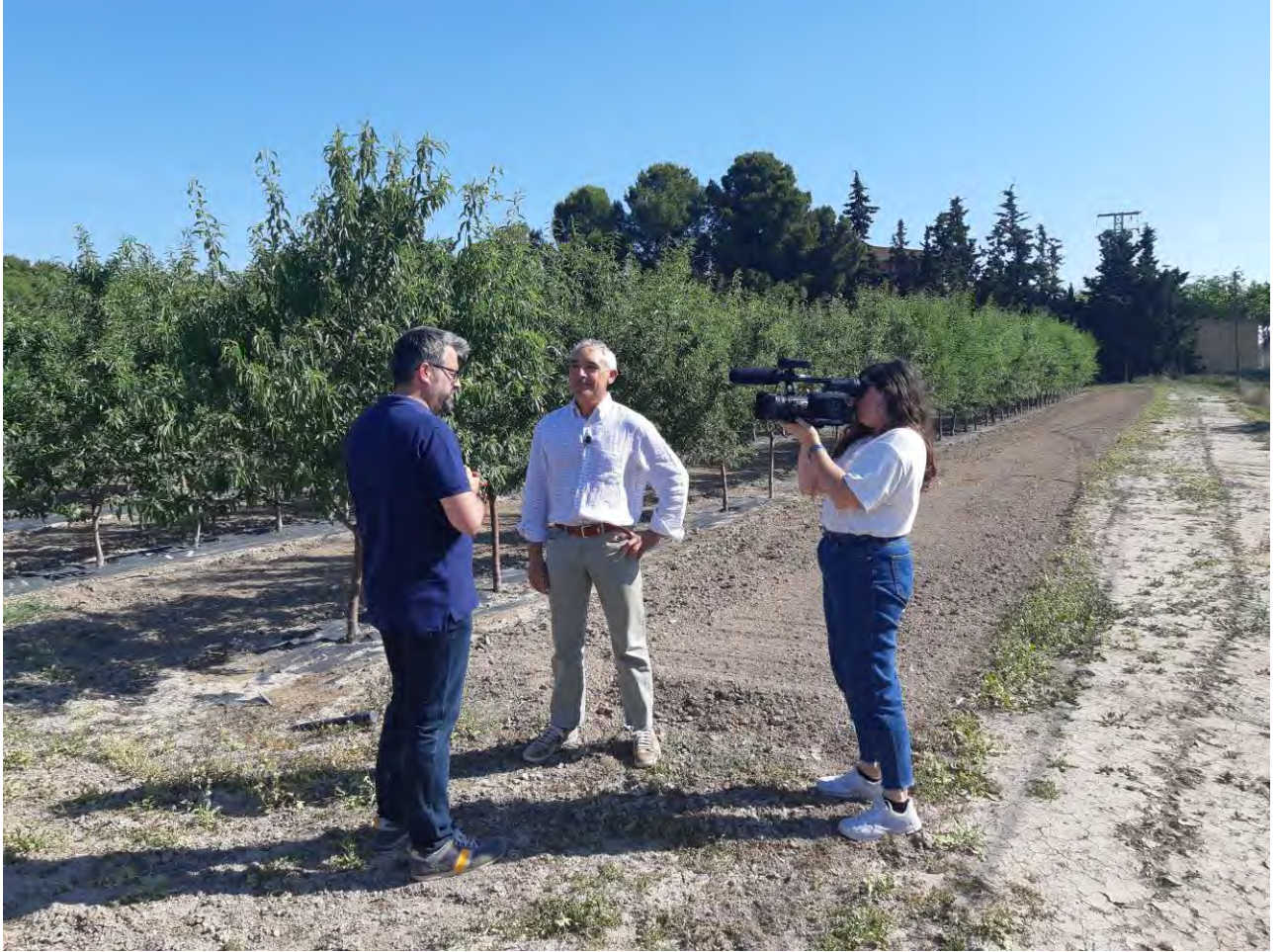
Foto nº 11. Entrevista en TV 7 a técnico del CIFEA sobre el ensayo (27/05/2019).