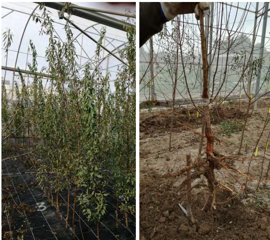
Fotos nº 5 y 6. Plantones en el vivero (enero 2017) y planta arrancada para trasplante (febrero 2017).