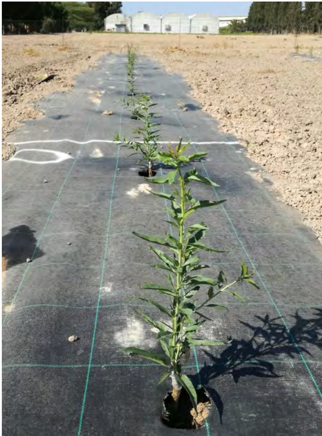
Foto nº 3. Desarrollo de los injertos a 21 de junio 2017.

Con los patrones en este estado, a continuación, se realizan los trabajos culturales de limpieza de los injertos, y se ponen tutores para obtener una planta con el tronco de unos 60 cm a partir de ahí se deja la formación libre con eje central para formar un seto o muro frutal.