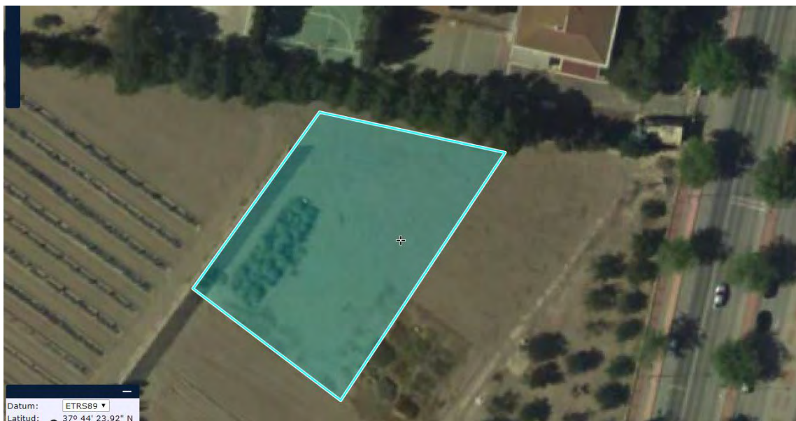
Figura nº 1. Ubicación de la parcela objeto del ensayo de patrones

Se trata de una parcela con una superficie total de 1700 m 2 , en la que se disponen 8 filas de árboles separadas 4 metros. Las filas se orientan norte sur (noreste suroeste) y su longitud va creciendo desde el borde oeste que linda con el cortavientos de la parcela de cítricos hasta el del este que limita con la parcela ensayo de parones de almendro en siembra directa.