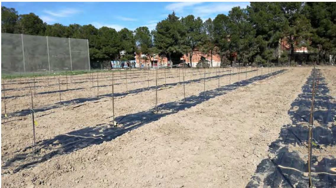
Foto nº 1. Parcela plantada febrero 2017

Se realizó el arranque a raíz desnuda, se seleccionan los mejores 12 árboles de cada semilla, dejando el resto para la fila borde.