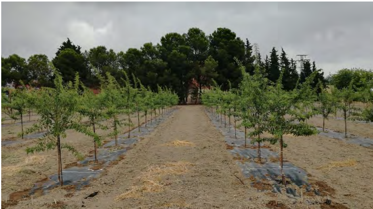
Foto nº 2. Parcela en julio 2017

Se han producido 7 marras en la plantación, pero en las filas borde, donde se colocó la planta de peor calidad, que hay que replantar en enero de 2018, con restos de planta que se dejó en el vivero.