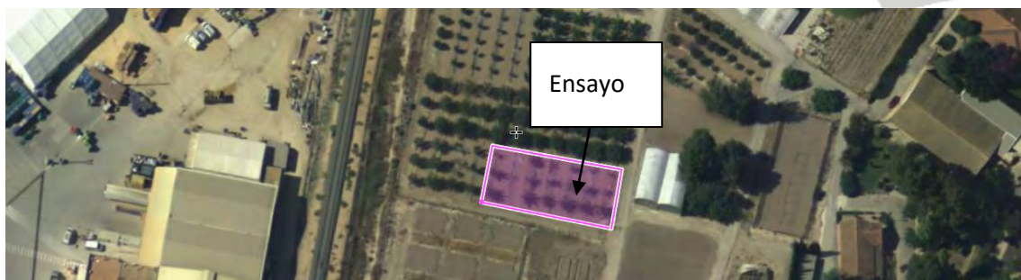
Figura nº1. Ubicación del ensayo de albaricoqueros en el CIFEA de Torre Pacheco