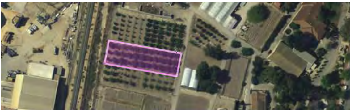
Figura nº 1. Ubicación del ensayo de variedades de almendro.

La referencia del SIGPAC del CIFEA, es Polígono 19 parcela 9000, en la que engloba una gran cantidad de terreno, en la que está el CIFEA.