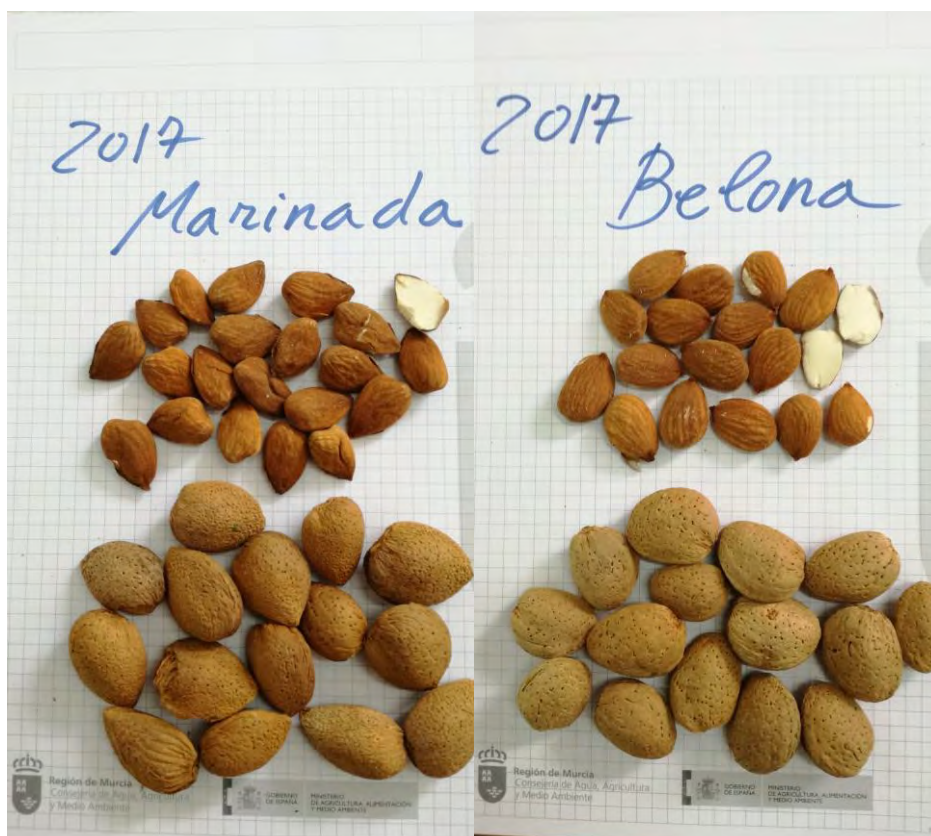
Fotos nº 2 y 3. Almendras de las variedades Marinada y Belona tras su recolección y seca.

Se realizará un escandallo para ver la calidad de los frutos; presencia de dobles, almendras enfermas o defectuosas, etc.