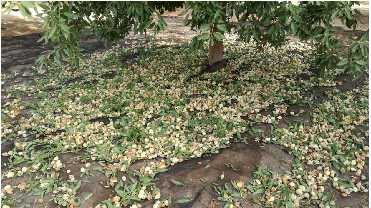
Foto nº 1. Recolección de variedad Constantí 31 agosto 2017