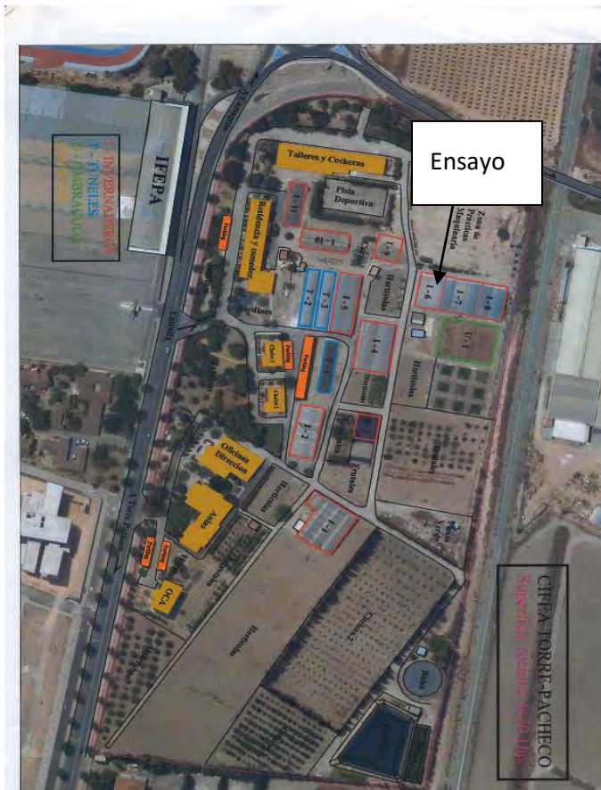
Figura 2: Plano del CIFEPA de Torre Pacheco

La superficie del ensayo será de 240 m 2 .