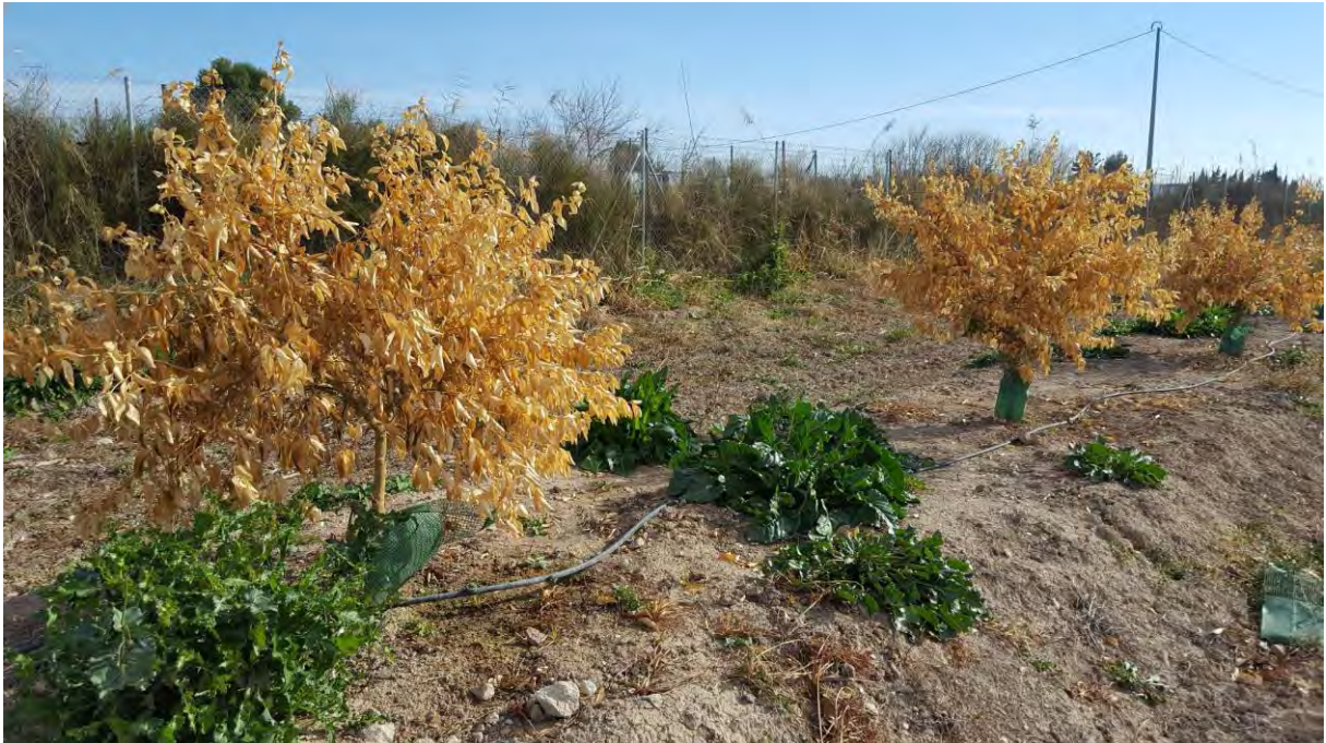
Lima mejicana tras heladas diciembre 2017.