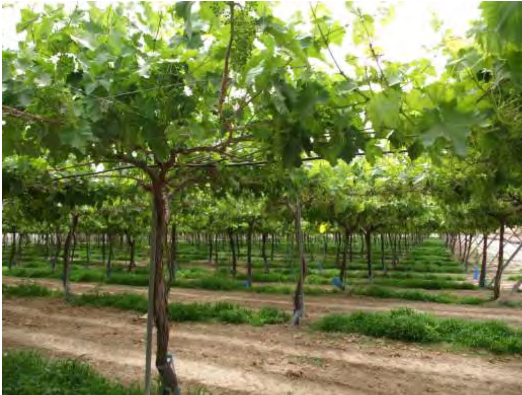
Estado fenológico K. Grano tamaño guisante.