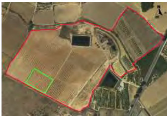
Croquis de ubicación de la parcela pistachos en el CDA La Nogueras.

Se trata de una pequeña parcela con coordenadas UTM-Huso 30 (ETRS-89) ubicada en la finca denominada Las Nogueras de Arriba, propiedad de la Comunidad Autónoma de la Región de Murcia, situada catastralmente en la parcela 385 del polígono 129 en el paraje Los Prados, Caravaca de la Cruz, según el croquis de ortofoto: