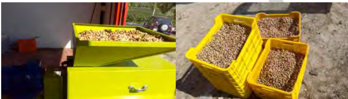
Máquina peladora de pistacho (Finca La Jabalina-Cehégín).

Los frutos recolectados se han cargado por variedades en cajas y han sido pelados, en húmedo, esa misma mañana en una finca particular. En todo caso, se debe hacer esta operación antes de 24 horas. Posteriormente al pelado se han secado, de forma natural, en las naves de la cooperativa Frutas Caravaca S coop.