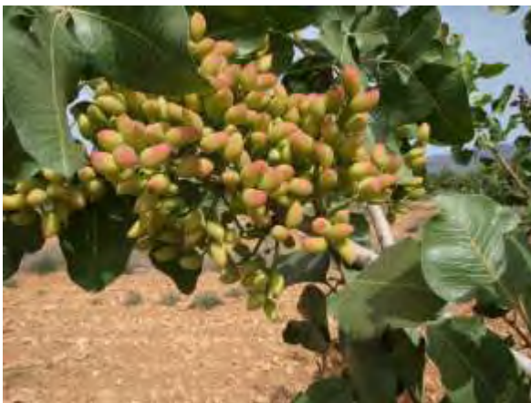
Variedad de pistacho Larnaka.