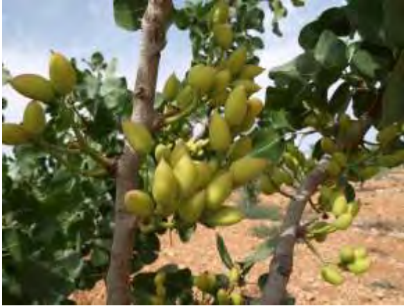
Variedad de pistacho Mateur.