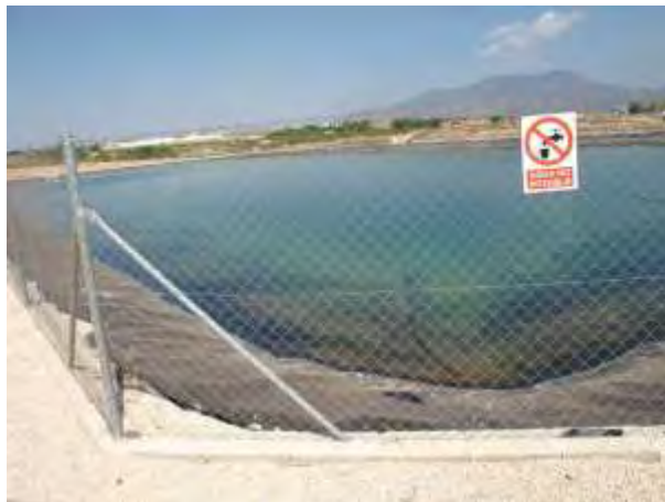
Embalse de riego Las Nogueras.