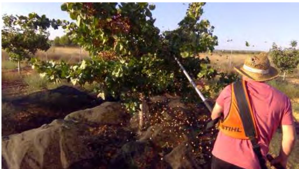
Detalle del proceso de recolección en el CDA Las Nogueras de Arriba con brazo vibrador.

La variedad más temprana, Sirora, se recogió el 19 de septiembre y el resto maduraron entre el 26 y 28 de este mes.