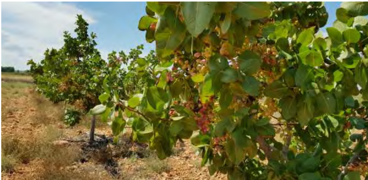
Parcela demostrativa de variedades de pistacho en CDA "Las Nogueras" (2018).