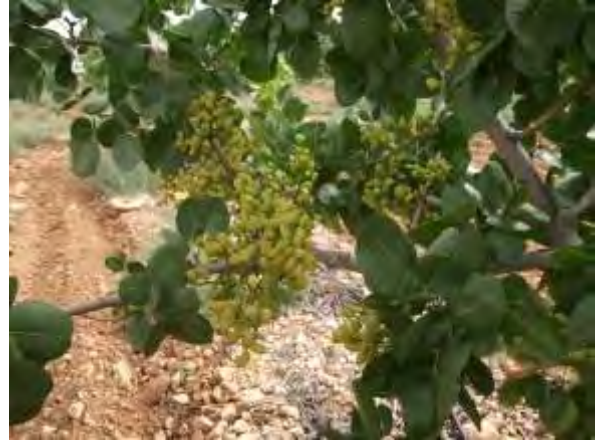
Variedad de pistacho Sirora.