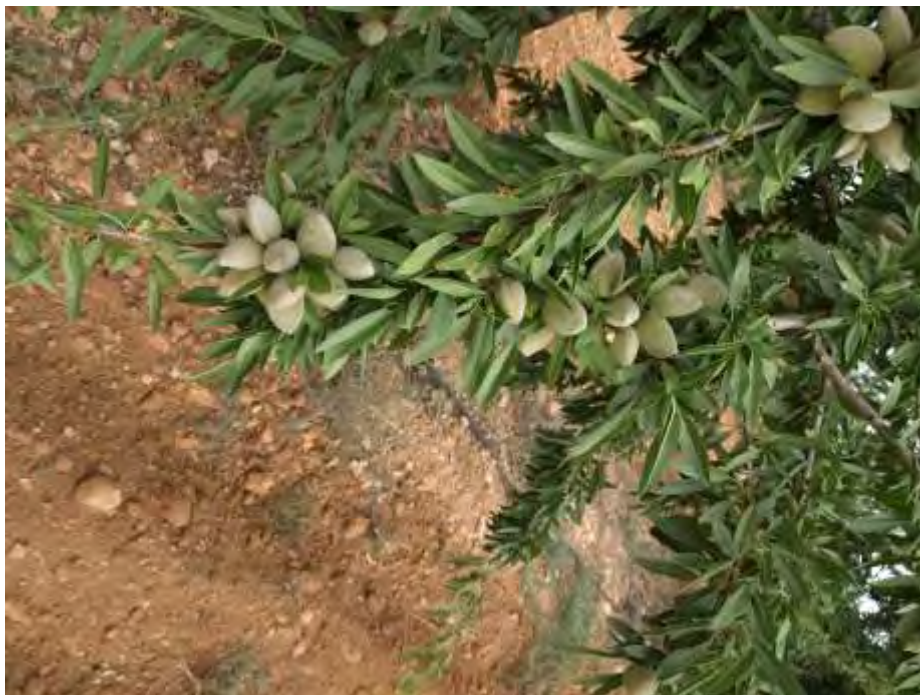
Rama de almendro de la variedad Lauranne 2018.

Los centros de investigación CEBAS (Murcia), CITA (Aragón), IRTA (Cataluña) e INRA (Francia) han puesto a disposición del agricultor nuevas variedades de almendro autocompatibles y de floración tardía, y más recientemente extratardía; aspecto éste que en nuestras condiciones climáticas del Noroeste con un alto riesgo de heladas es importante, por lo tanto en este proyecto de demostración y transferencia agrícola tratamos de mostrar el comportamiento de todas estas variedades que, a su vez, se encuentran injertadas sobre diferentes patrones y, todas ellas, ubicadas tanto en secano como en riego localizado en el Centro de Demostración Agraria (CDA) Las Nogueras de Arriba en Caravaca de la Cruz.