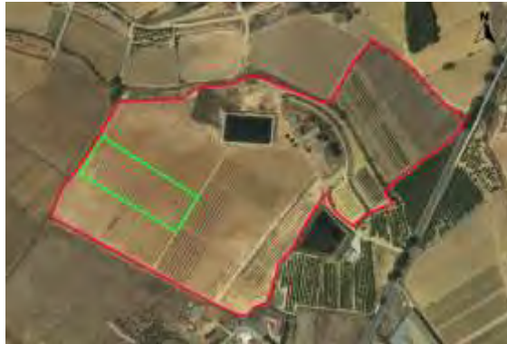
Croquis de ubicación de almendros CDA Las Nogueras.

El proyecto se desarrolla en la Finca Experimental de “las Nogueras”, en el término municipal de Caravaca de la Cruz, catastralmente en parte de la parcela 385 del polígono 129, ubicado entre las parcelas de demostración de nogal, al noreste y las de pistacho y trufa negra al suroeste, según el croquis de ortofoto: