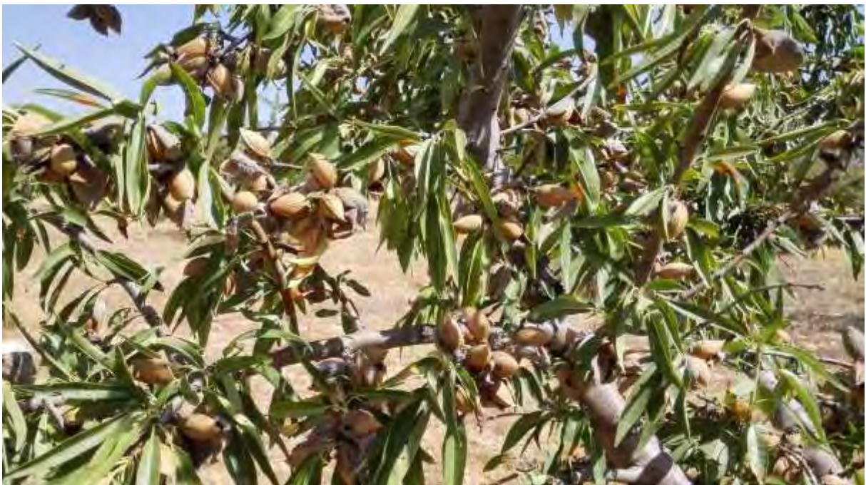
Detalle productivo de almendro 2018.

Para las selecciones CEBAS y con un año menos, destacan 360 y Macaco, con producciones que superan a algunas de las plantadas en 2014. Los datos productivos de todas las variedades se encuentran en las tablas finales.