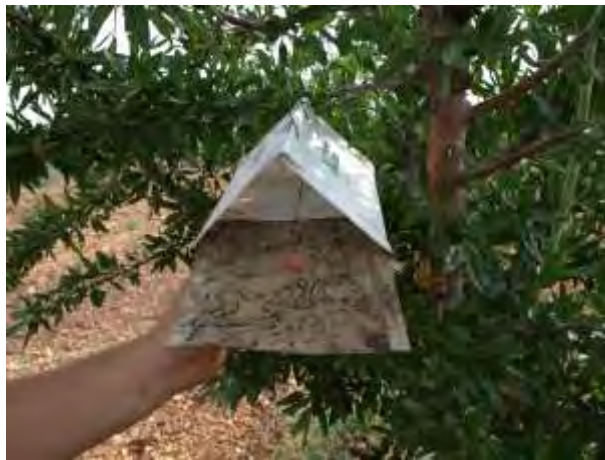
Trampa para el monitoreo de Anarsia lineatella (2018).

Se ha llevado a cabo un tratamiento de invierno con aceites minerales y cobre. Se realiza un monitoreo de Anarsia para control de la plaga. Sólo se han tratado árboles aislados injertados el año anterior y por lo tanto más sensibles.