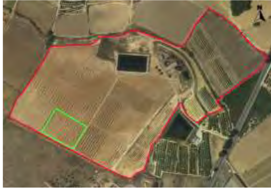
Croquis de ubicación de la parcela pistachos en el CDA La Nogueras.