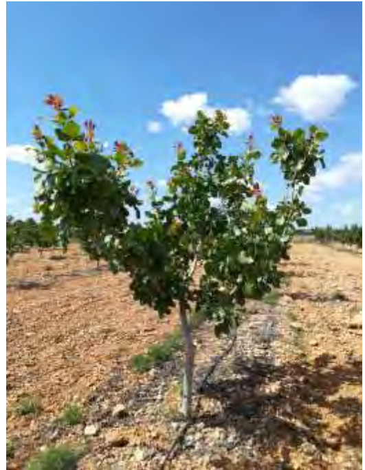
Parcela demostrativa de variedades y patrones de pistacho en CDA "Las Nogueras" (2018).