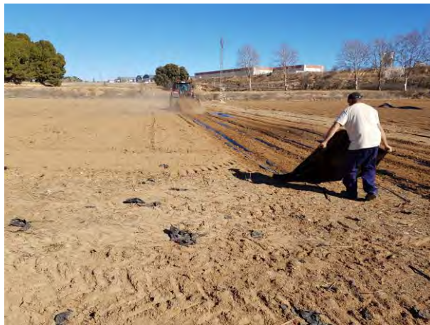
Labores de preparación del terreno.