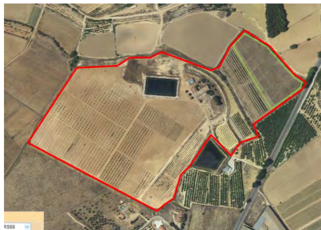
Ubicación parcela de plantas aromáticas para extracción de aceite esencial.

El proyecto se desarrolla en la Finca Experimental de “las Nogueras”, en el término municipal de Caravaca de la Cruz, catastralmente en parte de la parcela 385 del polígono 129, ubicado en el extremo noreste de esta parcela y lindando con la parcela demostrativa de melocotón al suroeste, según el croquis de ortofoto: