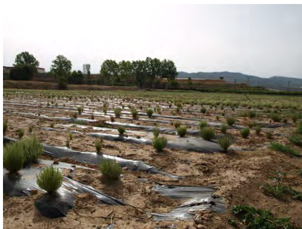
Cultivo de tomillo y mejorana en CDA Las Nogueras de Arriba.

La superficie de cultivo de plantas aromáticas y medicinales crece en la Región a un ritmo del 25 por ciento anual, y se concentra en las zonas mencionadas.