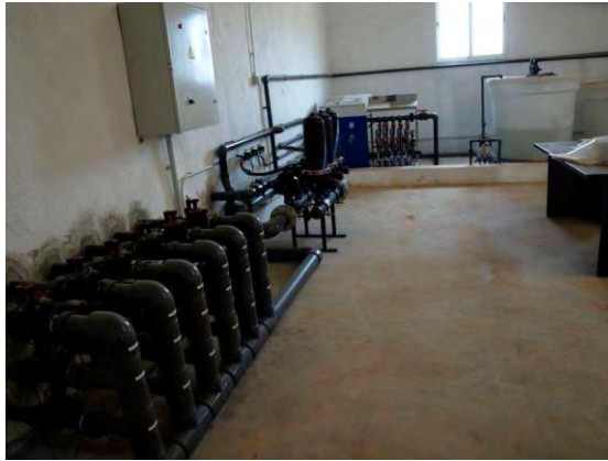
Cabezal de riego Las Nogueras de Arriba.

En cuanto a los nitratos, se seguirá el Código de Buenas Prácticas Agrarias. Para evitar la contaminación de acuíferos y de suelos por nitratos, los abonados nitrogenados se realizarán formas amoniacales u orgánicas. En el caso de abonados en forma nítrica estos se emplearan a bajas dosis y dosis asimilables por el cultivo para evitar su lixiviación.