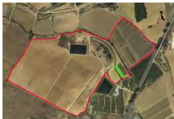
Croquis ubicación del cultivo del kiwi CDA Las Nogueras.

El proyecto se desarrolla en la Finca Experimental de “las Nogueras”, en el término municipal de Caravaca de la Cruz, catastralmente en parte de la parcela 385 del polígono 129, ubicado entre las parcelas de demostración de nogal, al noreste y las de pistacho y trufa negra al suroeste, según el croquis de ortofoto: