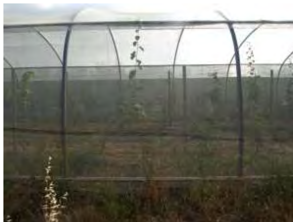
Plantación de Kiwis CDA Las Nogueras (2018).

Este proyecto tiene como fin determinar la viabilidad agronómica y económica de este cultivo