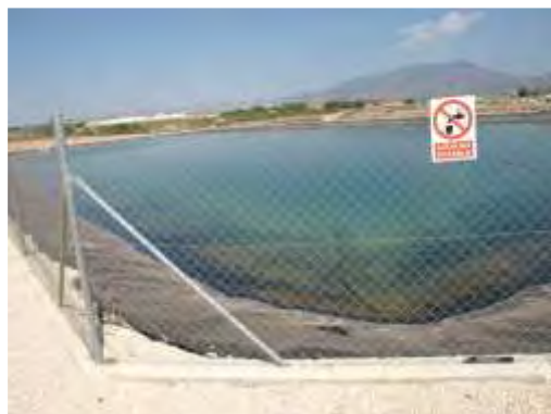
Embalse de riego Las Nogueras.