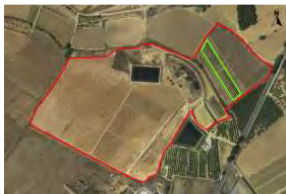
Croquis ubicación de melocotoneros CDA Las Nogueras.

El proyecto se desarrolla en la Finca Experimental de “las Nogueras”, en el término municipal de Caravaca de la Cruz, catastralmente en parte de la parcela 385 del polígono 129, ubicado entre las parcelas de demostración de nogal, al noreste y las de pistacho y trufa negra al suroeste, según el croquis de ortofoto: