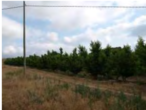
Parcela de ensayo de melocotoneros en Finca las Nogueras de arriba, Caravaca de la Cruz (2018).

La fruticultura del melocotón en la Región de Murcia es un referente en cuanto a calidades y producciones, existiendo un sector viverista y productor de planta muy dinámico en cuanto a la obtención de nuevas variedades. En la vega del Segura predomina el cultivo de variedades tempranas y extratempranas, por el contrario en el noroeste el cultivo del melocotón se centra en el cultivo de variedades de media estación y tardías, dada la climatología de la zona.