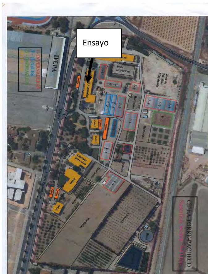
Figura 2: Plano del CIFEA de Torre Pacheco

La referencia del SIGPAC del CIFEA, es Polígono 19 parcela 9000, en la que engloba una gran cantidad de terreno, en la que está el CIFEA.