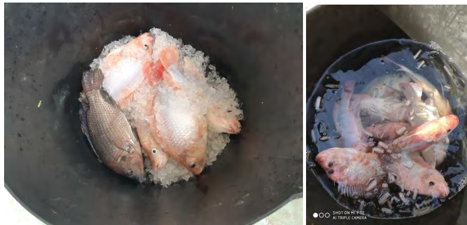
Sacrificio de tilapias por congelación (25/11/2020)

En la primera tabla, se puede ver que el peso medio de las tilapias, desde la puesta en marcha del ensayo, con los alevines de tilapia procedentes de Huerto Lazo, donde puede observarse el crecimiento y ganancia en peso hasta alcanzar los 735 gr. de media en octubre y en la tabla siguiente, el crecimiento de las tilapias nacidas en el ensayo.