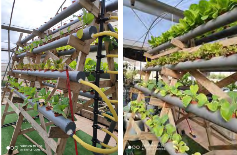
Sistema NFT de la planta nº 2.

El soporte tiene forma de barraca de 3 metros de altura con dos caras y 4 tuberías horizontales en cada cara, en la planta 2, ambas plantas con un conducto de drenaje conectado a los tanques de impulsión y de peces para recircular el agua, sistema cerrado.