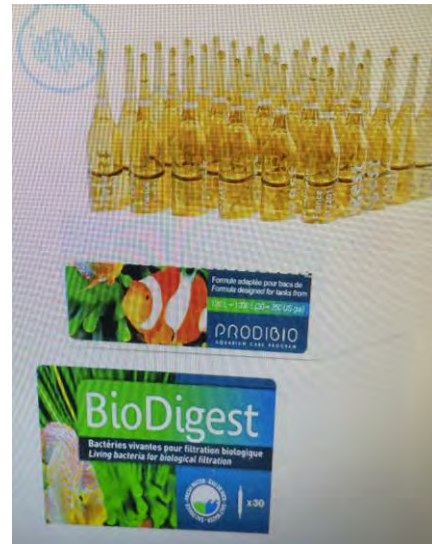
BACTERIAS FILTRANTES PARA INOCULAR