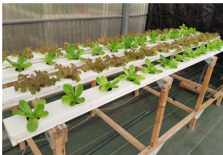
Tres tipos de lechugas en NFT planta 1 (30/09/2020)