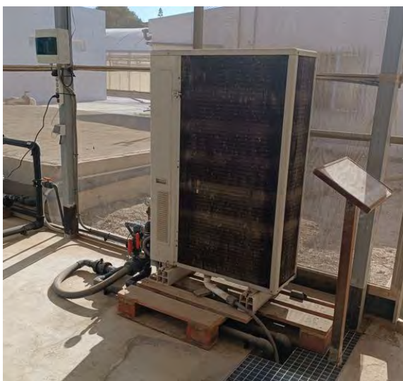
Bomba de calor instalada

La instalación de acuaponía se completa con la ejecución de la instalación eléctrica formada por conductores, protecciones (diferenciales y magnetotérmicos), enchufes, controladores de carga, bomba de calor, reguladores de temperatura, bomba para la recirculación del agua en el interior del esterilizador y elementos accesorios para su correcto funcionamiento.