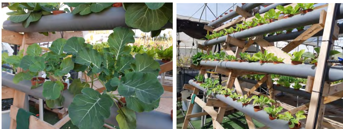
Brócoli en la planta nº 2 (16/01/2020) y nueva plantación el 12/03/2020

El pez tilapia es la elección más popular por el precio que éstos obtienen en el mercado, sus pocos requisitos de manutención (son vegetarianos), su facilidad de cría y la rapidez de crecimiento en altas densidades.