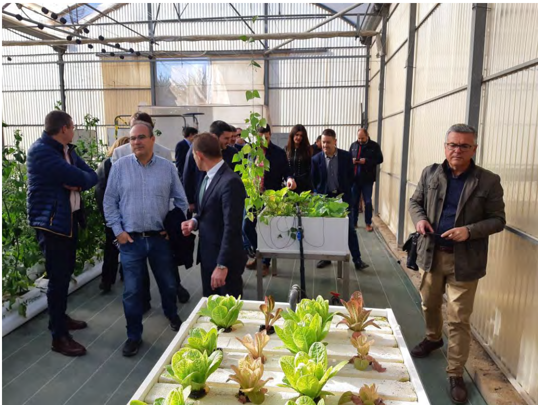
Visita Consejero, técnicos y alcalde de Torre-Pacheco a planta de acuaponía (06/03/2020)

A continuación se incluyen fotografías de las actuaciones de divulgación realizadas en la anualidad 2020.