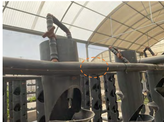
TUBERÍA PE 40 mm