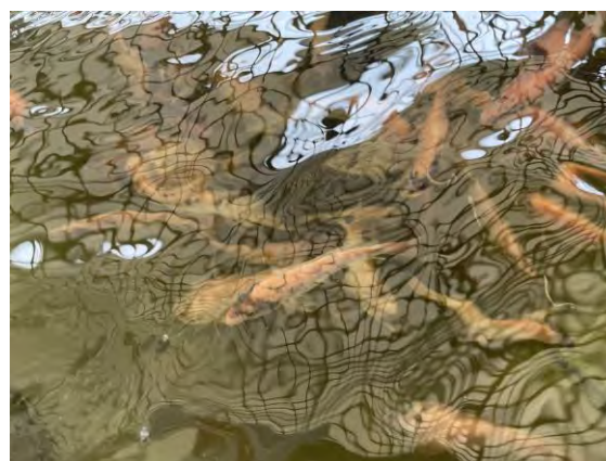
TILAPIAS DISTINTO TAMAÑO