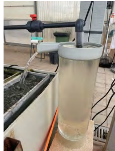
Jarra de incubación tipo MacDonald