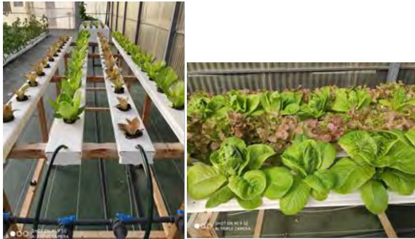
Sistema de cultivo NFT

Para mejorar la fase de producción de tilapias y poder así abastecer la planta nº2 con producción propia de alevines, se ha instalado un módulo para la producción de alevines, que sirve de complemento a ambas plantas (nº 1 y nº 2). Dicho módulo, está compuesto por: