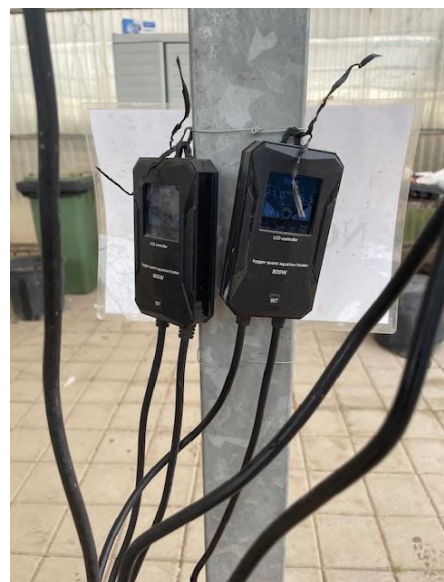
Reguladores de Tª de los calentadores

El módulo descrito sustituye a la incubadora casera que existía inicialmente y cuyo rendimiento no era acorde a las necesidades de alevines necesarias en las instalaciones de acuaponía del CIFEA de Torre Pacheco.