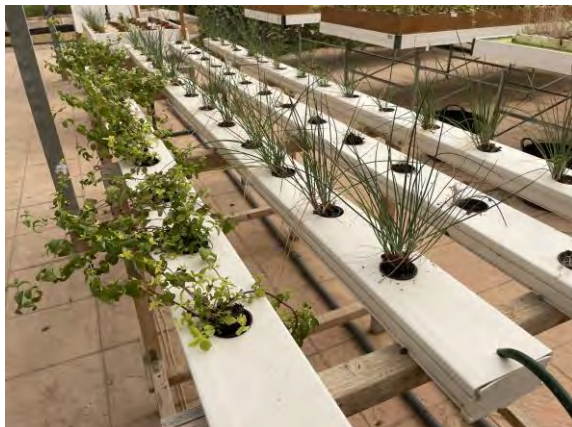
CANALETAS 40 x 20