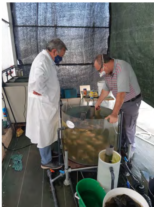
Control de crecimiento de las tilapias (02/11/2020)

La ración de alimento se preparaba según la biomasa y el tanto por ciento según la edad de las tilapias, para lo que se utiliza la tabla de Hernández et al (2014).