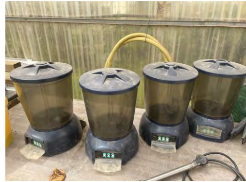
DISPENSADORES DE PIENSO