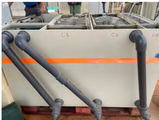
Depósito PP 672 litros

Adjuntamos fotografías de los citados componentes, instalados en el CIFEA de Torre Pacheco: