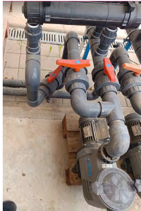
Bomba recirculación y esterilizador instalado

La alimentación a base de pienso comercial para el crecimiento de las tilapias desde que están en el T-1 de la P-1, y pienso especial para los alevines en la incubadora.