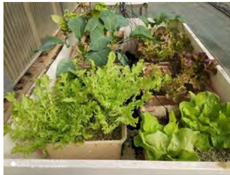
Sistema de cultivo en contenedores

Está compuesto por un conjunto de contenedores con algún tipo de sustrato en el cual se introduce un gotero. En este proyecto se optó por la fibra de coco como sustrato para este sistema hidropónico. Los contenedores drenarán dentro de un cajón y van a parar al conducto de desagüe.