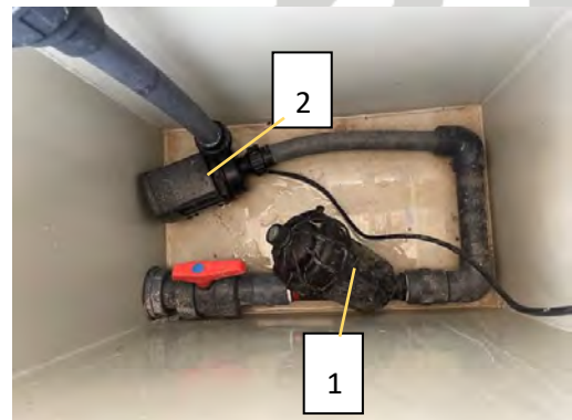
Biofiltro (1) y bomba recirculación 44w (2)