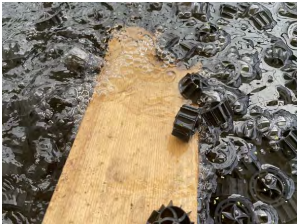
BIOBOLAS INOCULADAS CON BACTERIAS