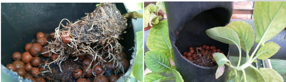
Producción en maceteros verticales (17/11/2020)

Al no realizar tratamientos fitosanitarios y la falta de tolerancia a determinadas enfermedades fúngicas, algunas especies no alcanzaban la calidad comercial, es el caso del melón, unido a la dificultad de su desarrollo por el volumen de vegetación y longitud de la misma, no haciéndolo aconsejable en este sistema. Las coles y romanesco, en sus fechas de plantación, forman una pella pequeña y el volumen de vegetación hace necesario mayor separación, no siendo indicado tampoco en este sistema. En cambio los cultivos de hoja, salvo en los meses cálidos (mayo-septiembre), la calidad ha sido buena, en el ciclo sep/nov, la hoja de roble con un peso de cogollo de 170 gr de media, romana de 300 gr, Little gem de 115 gr y escarola lisa de 220 gr. Hay que tener en cuenta que se recolecta sin esperar la maduración óptima. En cambio la lechuga iceberg, no tiene la calidad de cogollo adecuada.