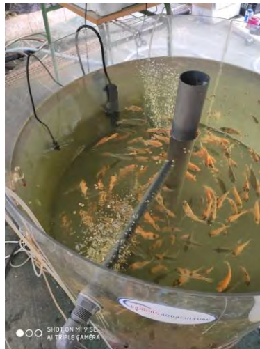
Tanque de peces de la planta nº 1

La planta nº 1, consta de un tanque, con una capacidad de 200 litros de agua fabricado de metacrilato, pensado para la producción de peces entre 45 a 70 días de vida, con un número aproximado de 120 unidades, más tanque decantador, tanque biofiltro, tanque aireación y tanque acumulador.