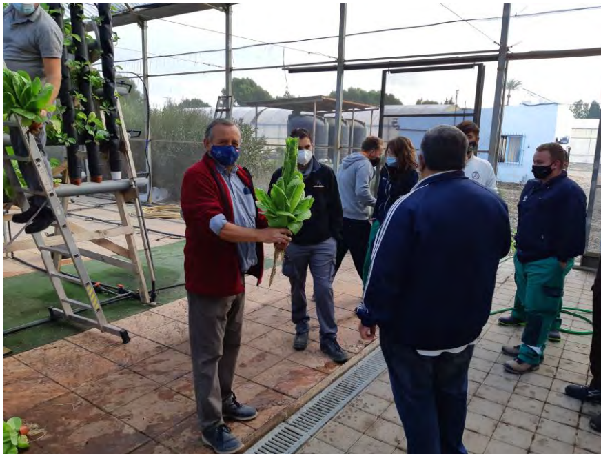
Explicación a técnicos del sistema de acuaponía y cultivo hidropónico (18/11/2020)