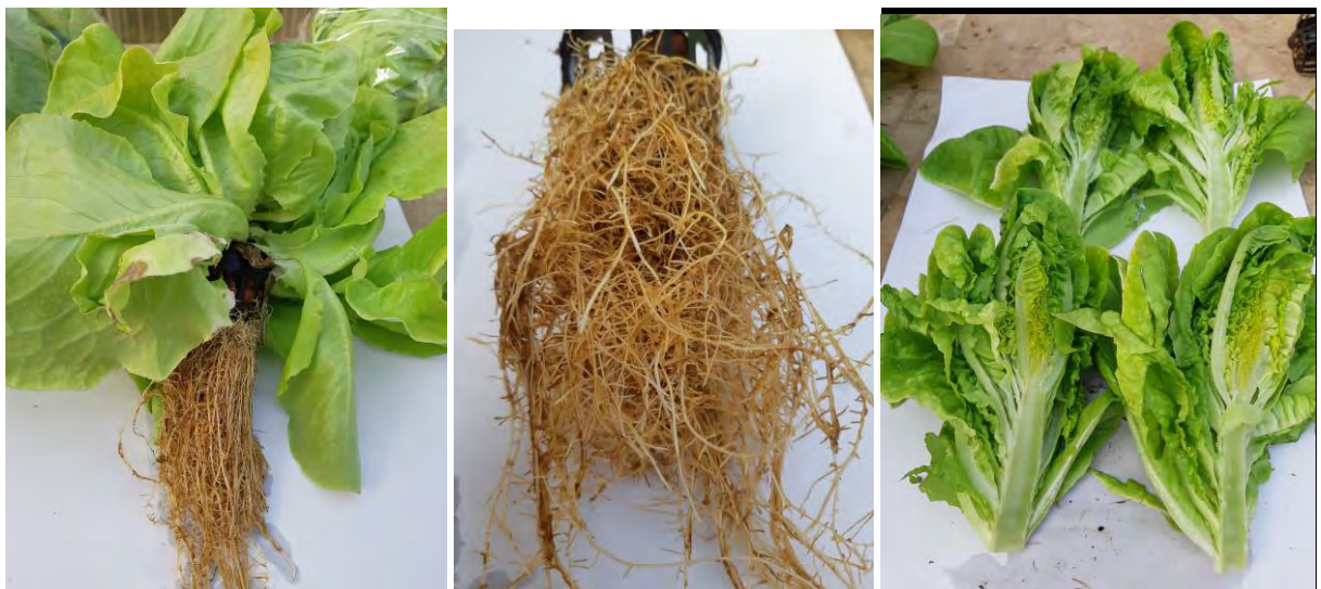
Recolección de lechugas para el control de producción (02/11/2020)