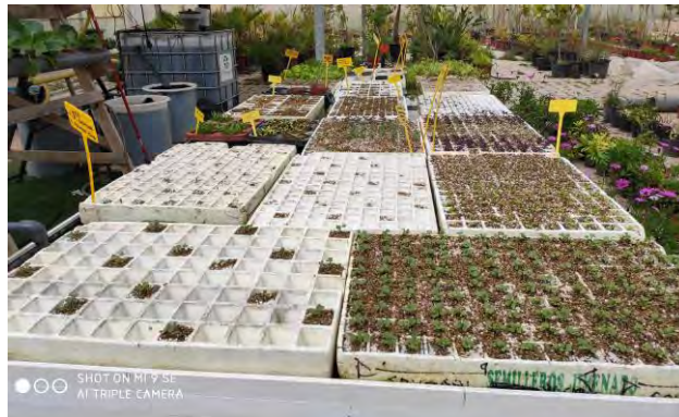
Sistema de producción en mesa de agua.

Las plantas van en estos orificios sujetas en unos vasos fisurados por donde van a emerger las raíces. Una vez que la planta de las bandejas está en condiciones para el trasplante, se pasa a la zona de cultivo y se vuelve a sembrar.