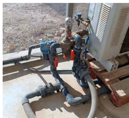
Sistema controlador de presión instalado