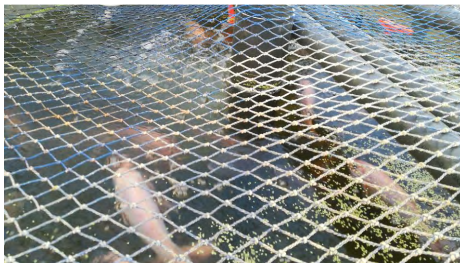
Malla protectora para evitar el salto de las tilapias (29/12/2020)