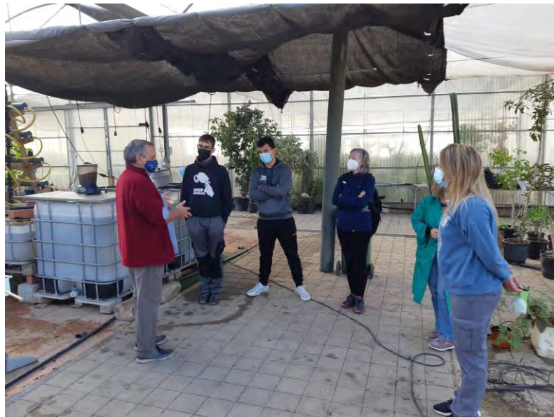
Explicación a técnicos y agricultores del sistema de acuaponía (18/11/2020)

Nota aclaratoria: Debido a la detección de algunas erratas en el documento enviado inicialmente, la presente memoria de resultados ha sido revisada, corregida y firmada nuevamente, en julio de 2024.