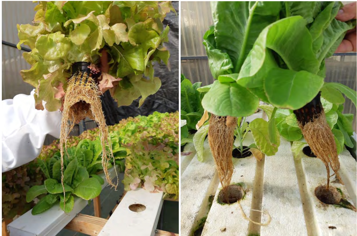
Producción de lechuga en sistema NFT (02/11/2020)