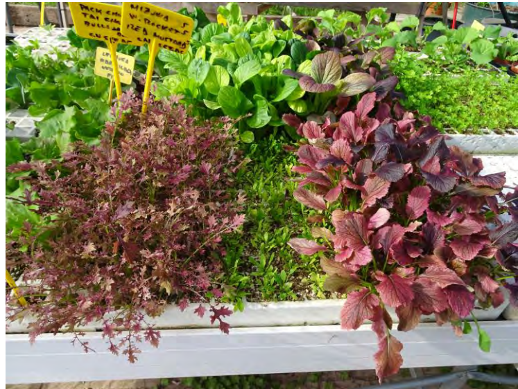
Cultivos en mesa de agua, planta 2.