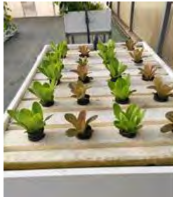
Sistema de cama de agua

Consiste en un cajón impermeable (PVC, PE, EPDM) al que se coloca una lámina de espuma de poliestireno que flota en la solución nutritiva. La lámina de poliestireno debe ser perforada en diversos puntos con un marco de plantación definido. Las plantas van en estos orificios sujetas en unos vasos fisurados por donde van a emerger las raíces.