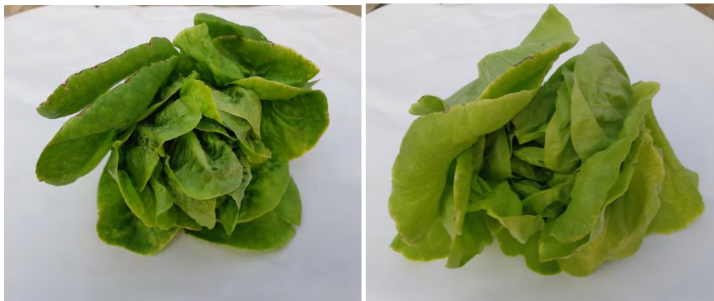
Lechuga Baby y lechuga Batavía en estado cercano a la recolección