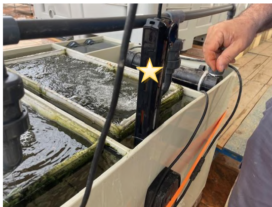
Calentadores de Titanio