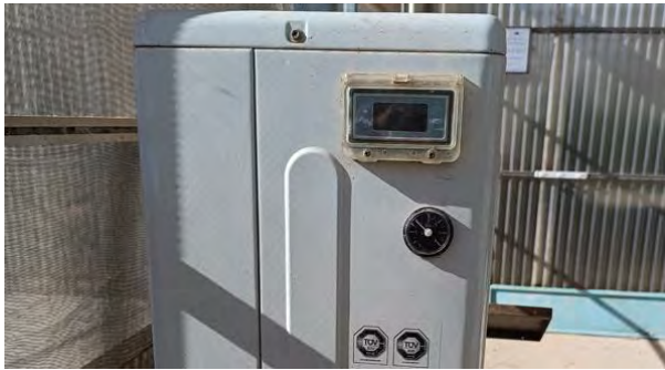
Regulador de temperatura instalado