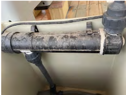
Esterilizador UV de polietileno (36 w)