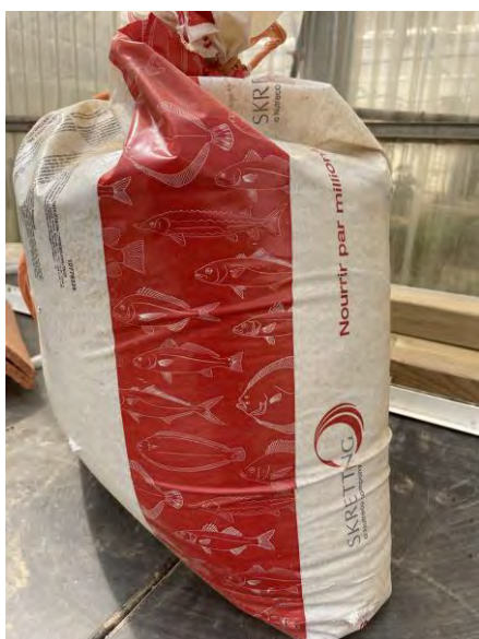
PIENSO DE PECES

Durante el desarrollo del presente proyecto se han consumido 10 sacos de pienso para tilapias y se han adquirido 300 unidades de tilapias de distintos tamaños.