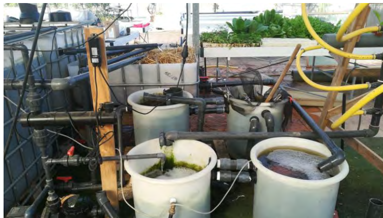
Depósitos de aireación planta nº 2 (29/10/2020)