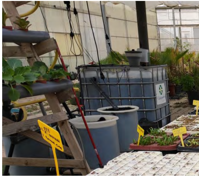
Tanques de peces planta nº 2.

La planta nº 2, consta de un tanque y posteriormente se añade otro tanque, con capacidad de 900 litros fabricado en PVC y que pueden albergar entre 100 y 130 unidades de tilapias, según tamaño, tanque decantador, tanque biofiltro y tanque acumulador. En el tanque de peces se produce el engorde de la tilapia hasta conseguir el tamaño comercial, que se considera a partir de 400 gramos, aproximadamente.