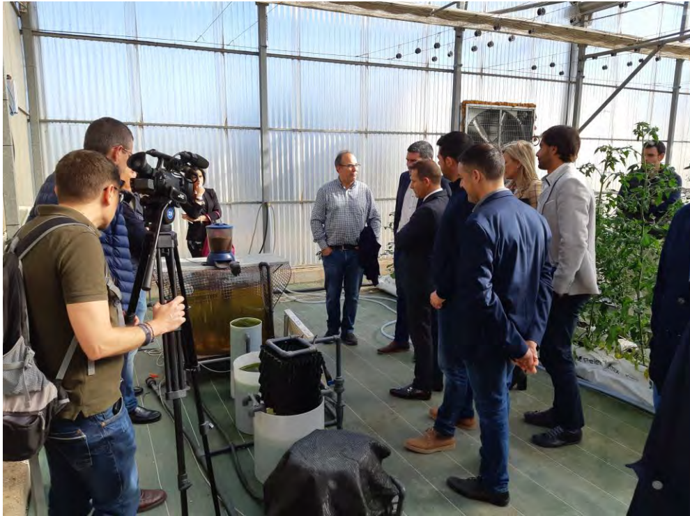
Visita Consejero, técnicos y alcalde de Torre-Pacheco a planta de acuaponía (06/03/2020)