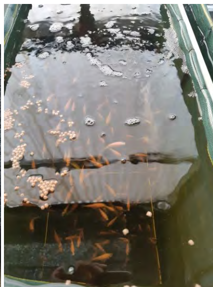
Nuevo depósito (672 l) de cría de alevines (02/11/2020)