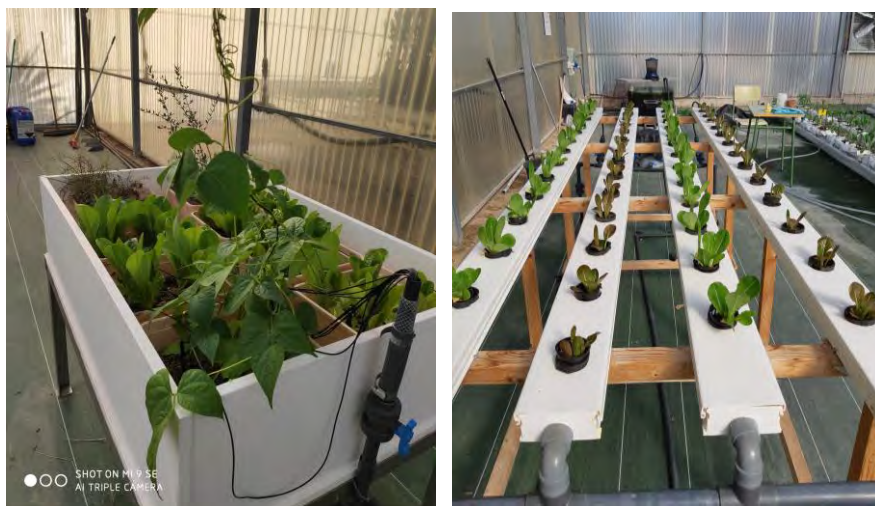
Contenedores y sistema NFT en planta nº 1 (03/02/2020)

En la planta nº 1, se han trasplantado Little roja y verde en la cama de agua y NFT. En los contenedores, se van a ir sembrando: rabanitos, acelgas, espinacas y 3 plantas de tomate. Posteriormente se irá sembrando judía de enrame, zanahoria, puerro, cebollino, etc., para ver su comportamiento.