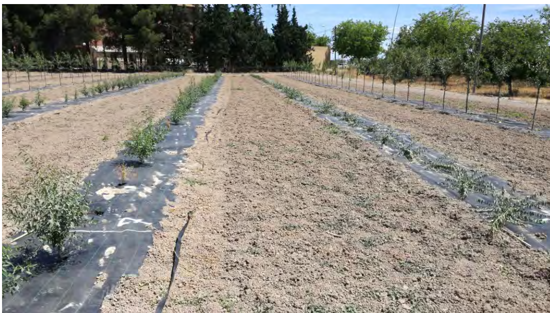
Foto nº 1. Fila de la derecha decapitada una semana después del injerto, 15 de mayo de 2017.

Una semana después de realizado el injerto se procede a decapitar el patrón para forzar la brotación del injerto. Esta operación es la más delicada porque hay que tener un alto porcentaje de prendimiento para que sea viable.