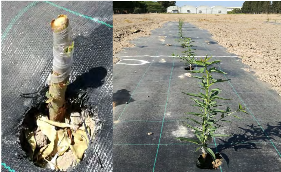
Fotos nº 2 y 3. Detalle de árbol injertado, 15 de mayo de 2017. Desarrollo de los injertos 21 de junio 2017.

A continuación, se realizaron los trabajos culturales de limpieza de los injertos para obtener una planta con el tronco de unos 60 cm, a partir de ahí se deja la formación libre con eje central para formar un seto o muro frutal.