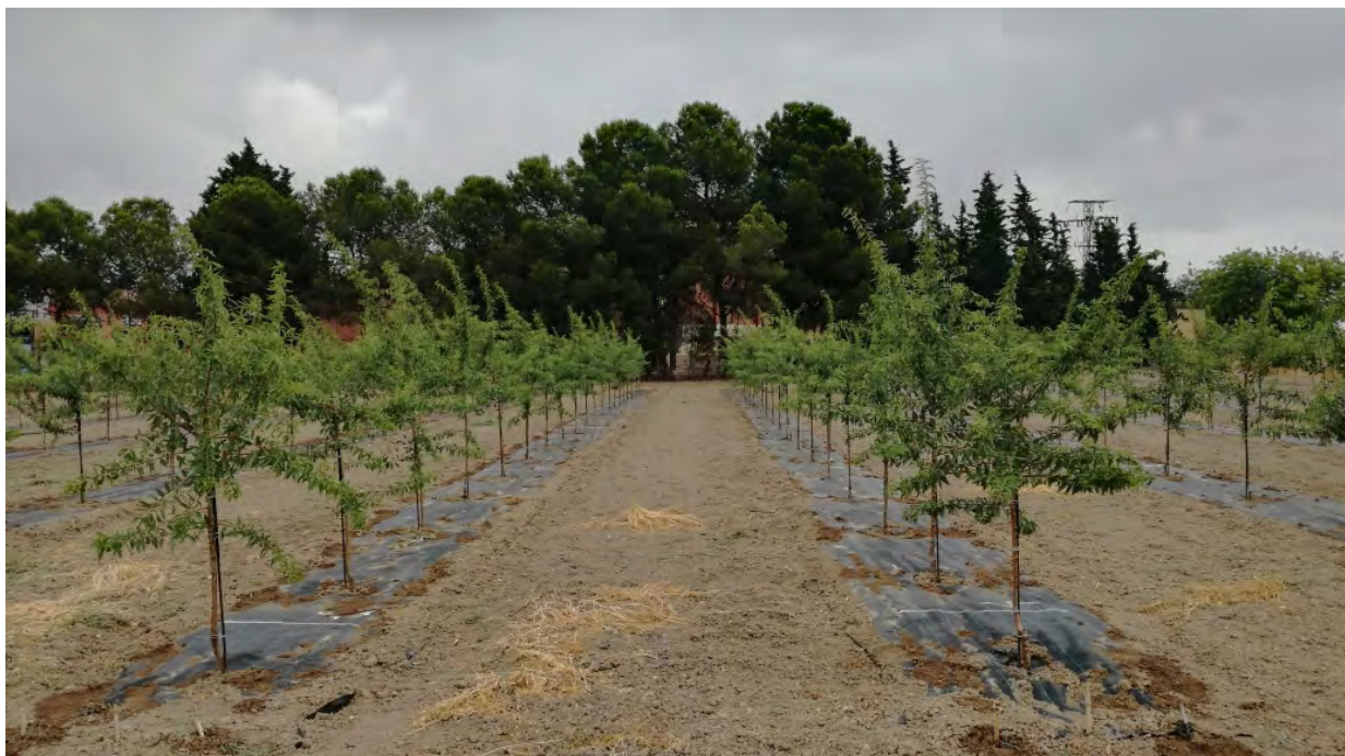
Foto nº 2. Parcela en julio 2017

Se produjeron 7 marras en la plantación, pero en las filas borde, donde se colocó la planta de peor calidad, que se replantaron en enero de 2018, con restos de planta que se dejó en el vivero.