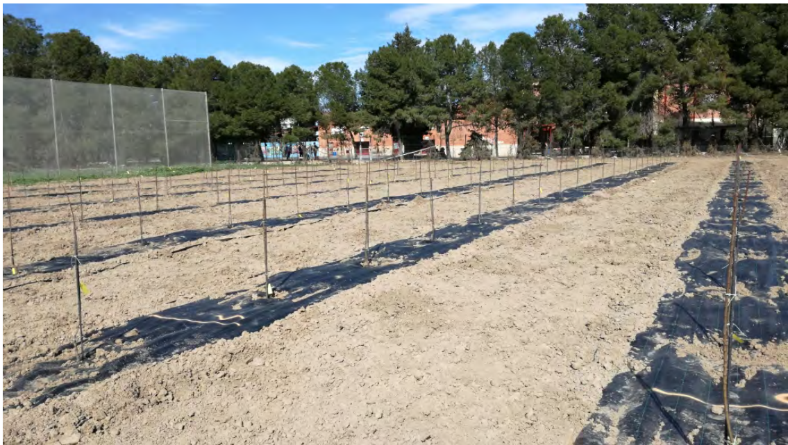
Foto nº 1. Parcela plantada febrero 2017

Se realizó el arranque a raíz desnuda, se seleccionan los mejores 12 árboles de cada semilla, dejando el resto para la fila borde.