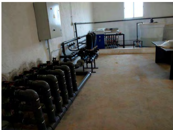
Cabezal de riego Las Nogueras.

Uso de programas de riego para evitar un consumo innecesario del agua. Este programa de riego tiene en cuenta parámetros como el clima y los datos del cultivo.