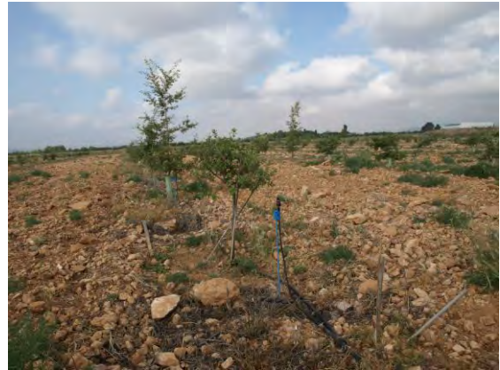
Riego por aspersión quercus-trufa.

De la totalidad de cultivo se encuentran en secano 0,18 ha y con apoyo de riego por aspersión programado en los meses de mayo a octubre 0, 47 ha. Los aspersores están colocados en la línea de plantación, a 1 aspersor por árbol. El riego de apoyo tiene como fin salvar la estación seca y que el cultivo simbiótico pueda continuar y completar su ciclo durante el otoño y el invierno.