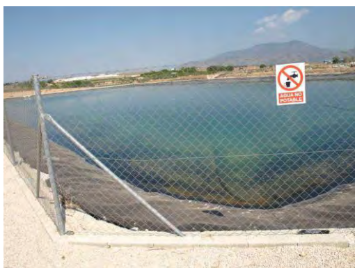
Embalse de riego del CDA Las Nogueras.