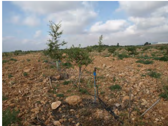
Parcela de quejigos y encinas micorrizadas con trufa negra en la Nogueras 2018.

Con este proyecto se pretende comprobar la adaptación del cultivo de encinas y quejigos, con elevados porcentajes de micorrización con trufa negra " Tuber melanosporum ", para hacer rentables determinadas superficies agroforestales, en condiciones específicas de suelos calizos, pedregosos y clima por encima de los 700-800 m. de altitud, de las que disponemos de manera más abundante que en el resto de la Región y donde las alternativas son muy reducidas.