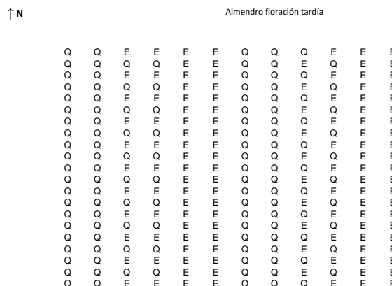
Croquis de distribución de la parcela de quejigos y encinas.

El marco de plantación es 7 X 3,5 m, lo que supone una densidad, de 400 plantas/ha.