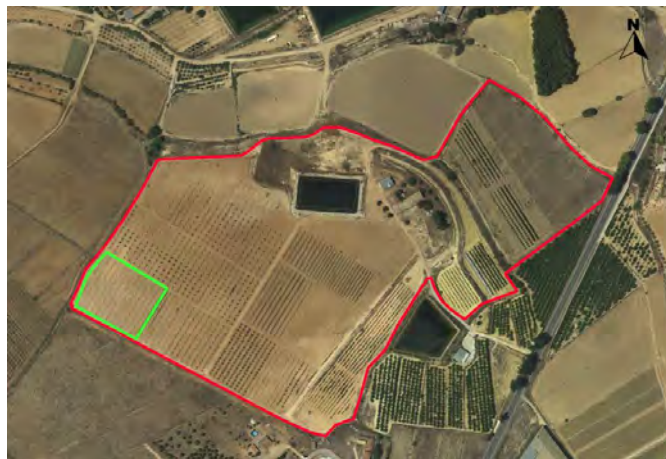
Croquis de Ubicación de la parcela de quejigos y trufa en el CDA Las Nogueras.

El proyecto se desarrolla en la Finca Experimental de “las Nogueras”, en el término municipal de Caravaca de la Cruz, catastralmente en parte de la parcela 385 del polígono 129. La parcela donde se ubica el cultivo de trufa negra se encuentra en el extremo sur-oeste de la finca con coordenadas UTM-Huso 30 (ETRS-89); 595584 /4210772. Está situado entre las parcelas experimentales de Pistacho y Almendro de floración tardía.