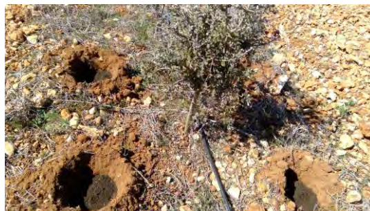
Formación de nidos truferos en CDA Las Nogueras.

La plantación de encinas y quejigos se realizó en marzo de 2014 y se repusieron las marras ocasionadas. Los nidos truferos se formaron unos, con incorporación de substrato esterilizado y con esporas del hongo, otros con el mismo substrato y trufas de segunda categoría ralladas, en noviembre 2017 y una tercera tanda, con humus de lombriz y esporas del hongo, en abril de 2018.