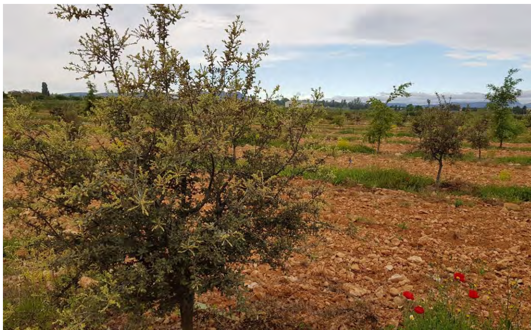
Parcela experimental de quercus para producir trufa negra en la primavera de 2020

Se busca además precisar y transferir el manejo y las mejores técnicas de cultivo, su desarrollo, producciones y ofrecer datos que permitan, en manos del agricultor, una mayor diversificación, sobre todo en zonas con alta protección medioambiental, junto con la producción de cereales, frutos de cáscara y ganadería, en tanto que su rentabilidad y demanda parecen favorables.