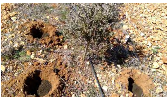
Formación de nidos truferos en CDA Las Nogueras.

Los nidos truferos se formaron con incorporación de sustrato esterilizado y con esporas del hongo, tras adicionarle trufas de segunda categoría, secas previamente o congeladas y ralladas, en los cuatro años mencionados.