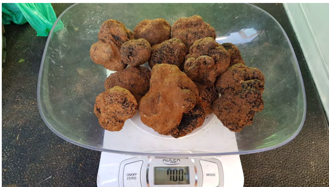
Producción de una de las salidas de 2020

Los datos de recolección por fechas se sumen en el último de los 3 completados, donde están acumuladas las producciones recogidas: