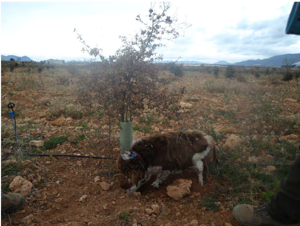
Detalle del perro marcado la zona donde se encuentra la trufa.

El calendario de recolección de la campaña 2019-2020 se ha distribuido en 11 salidas de y han sido: