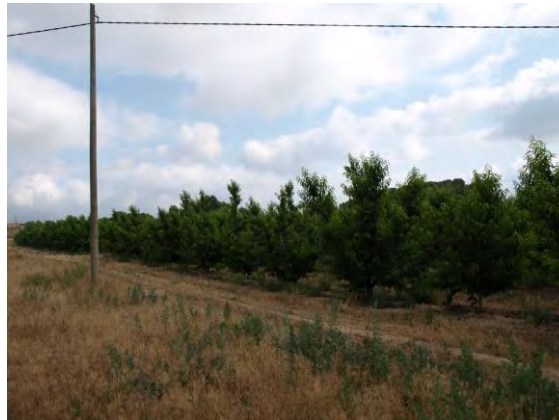
Parcela de ensayo de melocotoneros en Finca las Nogueras de arriba, Caravaca de la Cruz (2018).

La fruticultura del melocotón en la Región de Murcia es un referente en cuanto a calidades y producciones, existiendo un sector viverista y productor de planta muy dinámico en cuanto a la obtención de nuevas variedades. En la vega del Segura predomina el cultivo de variedades tempranas y extratempranas, por el contrario en el noroeste el cultivo del melocotón se centra en el cultivo de variedades de media estación y tardías, dada la climatología de la zona.