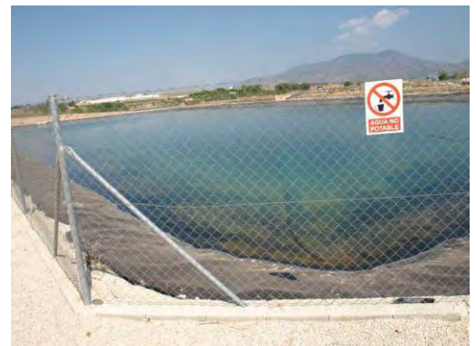
Embalse de riego Las Nogueras.