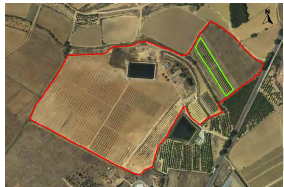
Croquis ubicación de melocotoneros CDA Las Nogueras.

El proyecto se desarrolla en la Finca Experimental de “las Nogueras”, en el término municipal de Caravaca de la Cruz, catastralmente en parte de la parcela 385 del polígono 129, ubicado entre las parcelas de demostración de nogal, al noreste y las de pistacho y trufa negra al suroeste, según el croquis de ortofoto: