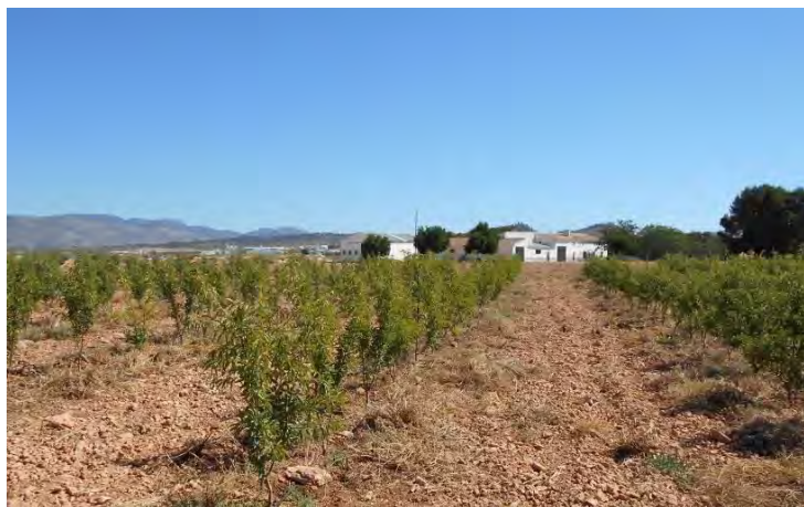
Almendros en intensivo en CDALas Nogueras a marco de 4 x 1,25 m (2016).

Marinada) así como el empleo de dos patrones de distinto vigor GF 677 para marcos mayores y Rootpac®-20 para los menores.