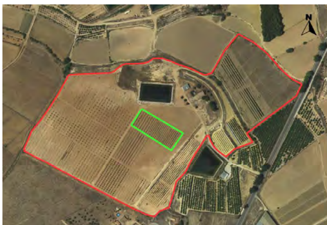
Ubicación de los almendros en intensivo.

El proyecto se desarrolla en CDA Las Nogueras de Arriba, en el término municipal de Caravaca de la Cruz, catastralmente en parte de la parcela 385 del polígono 129. La ubicación de los almendros intensivos se encuentra en una parte de la finca próxima al embalse y a la izquierda del camino central de acceso, tiene coordenadas UTM-Huso 30 (ETRS-89); 595834/4210793.