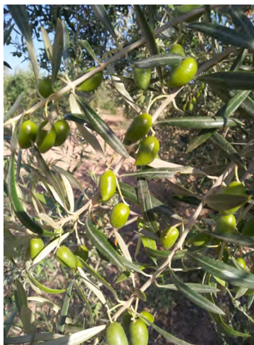
CORNICABRA DE TOLEDO