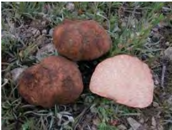
Foto1: Terfezia claveryi

Indicar Terfezia claveryi es una especie primaveral que crece en terrenos básicos, asociada a las raíces de Helianthemum spp. , que se distribuye por la zona este de la Península Ibérica, presenta carpóforos globosos de 2-12 cm de diámetro con forma de tubérculo y superficie pardo-rojiza. El interior es rosa pálido. Muestra un olor ligeramente fúngico, perfumado y agradable. El sabor recuerda sutilmente al de la avellana, con una textura compacta incluso crujiente, muy placentera en boca.