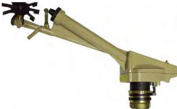
Foto nº 15. Cañón agrícola empleado en la instalación.

En cada una de las tres parcelas según el tipo de laboreo, se instalarán 2 sondas a una profundidad de 30 cm en cada parcela, que pueden ser sondas de humedad volumétrica o tensiómetros, en función del presupuesto disponible. Esto se irá realizando en sucesivas anualidades, cuando se ensayen los sistemas de laboreo. El objetivo es ver la evolución tanto del incremento de humedad tras una lluvia, diferente en función de la distinta infiltración y escorrentía, como el secado del suelo posterior como consecuencia de la evaporación de la superficie del suelo.