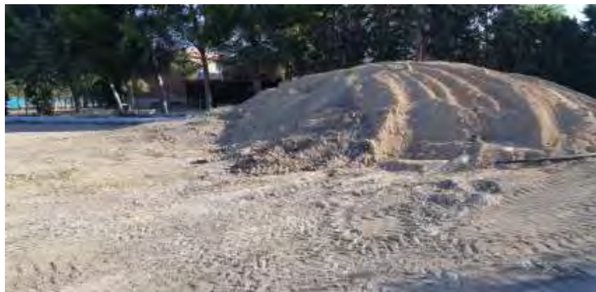
Foto nº 4. Aporte de tierras para pendiente artificial (28/06/2021).