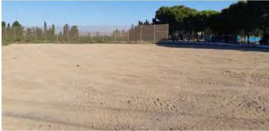
Foto nº 3. Terreno explanado tras el arranque de almendros (28/06/2021).