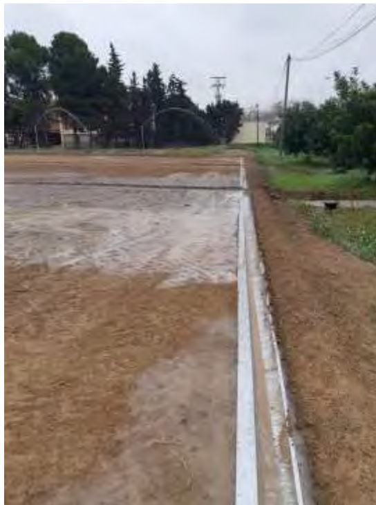
Foto nº 17. Vertido de agua de escorrentía al canal (22/11/2021).