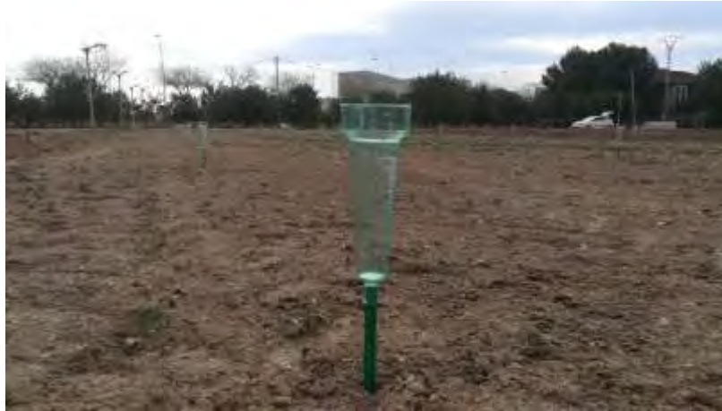
Foto nº 18. Prueba inicial de homogeneidad con colocación de 99 pluviómetros

De estos datos destaca que a partir de una precipitación, la escorrentía aumenta de forma muy importante y se ha visto, como era de esperar, que la hierba tiene una capacidad de retención muy aceptable en comparación con el suelo desnudo.