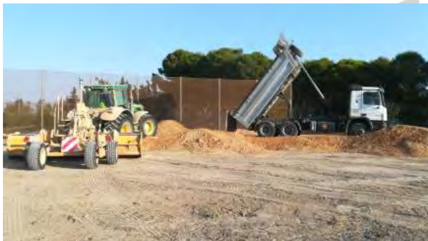
Foto nº 5. Aporte de tierras: camión y trailla transportadora con láser nivelador (19/08/2021).