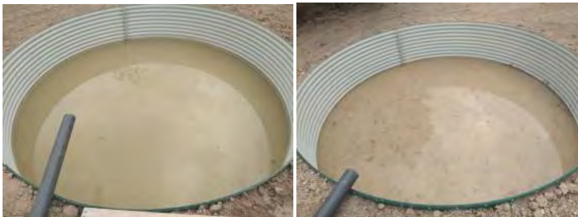
Foto nº 19. Prueba inicial de escorrentía, volumen recogido en los tres aforadores (20/01/2022).