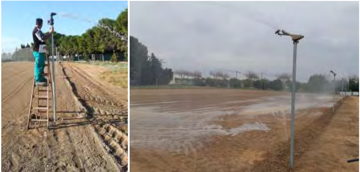
Foto nº 10. Aspersores de cañón y tuberías de conducción en altura para simulación de lluvia artificial. Fotos 19/11/2021 y 22/11/2021.