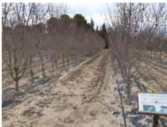
Foto nº 2. Parcela dónde se ubicaba el ensayo de patrones de almendros, donde va actualmente el nuevo ensayo de escorrentía (25/01/2021).

La parcela de unos 2.000 m 2 está subdividida en 3 subparcelas para los diferentes ensayos, de dimensiones interiores (sin contar divisoria) de 49 x 12 m 2 , o sea que cada parcela elemental tiene una superficie de 588 m 2 . En la memoria inicial se planificó una parcela adjunta a esta, pero dado que se produjo el arranque de los almendros por haber dado por finalizado el ensayo y por ser más conveniente por las pendientes, se ha ubicado aquí la parcela.