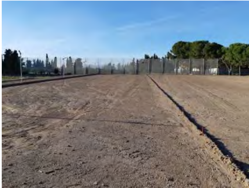
Foto nº 14. Caballones separadores en parcela de esorrentía, laboreo y formación de cárcavas (30/11/2021).