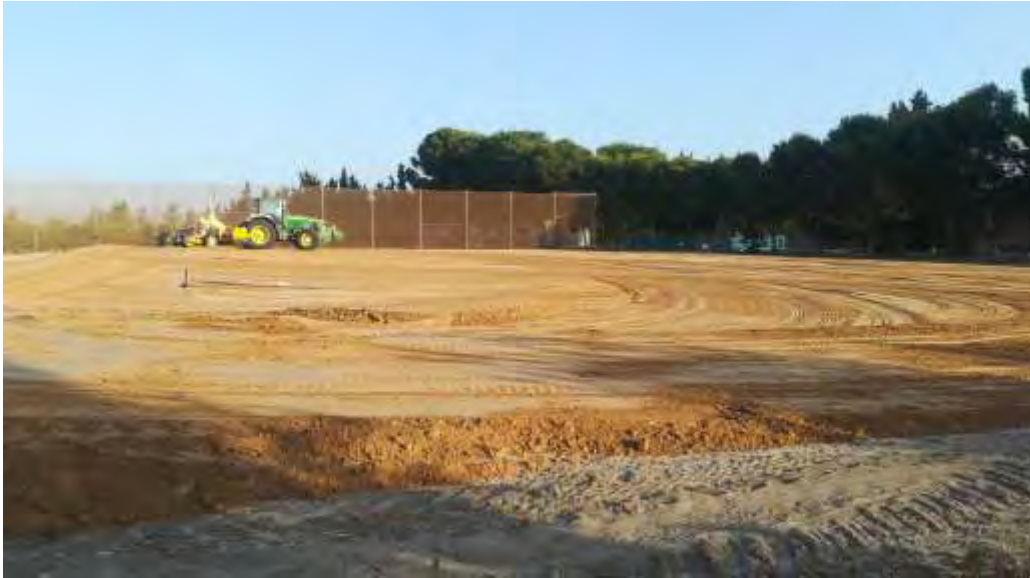
Foto nº 6. Formación de la pendiente con traílla transportadora con láser nivelador (20/08/2021).