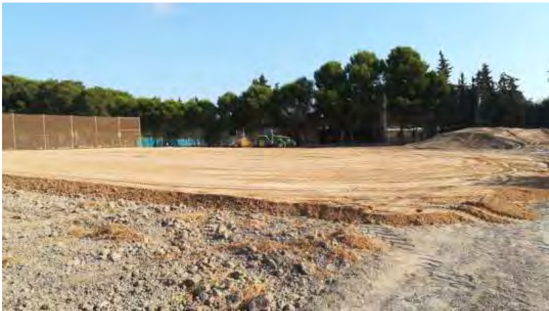
Foto nº 7. Parcela con la pendiente del 2% ya formada (20/08/2021).