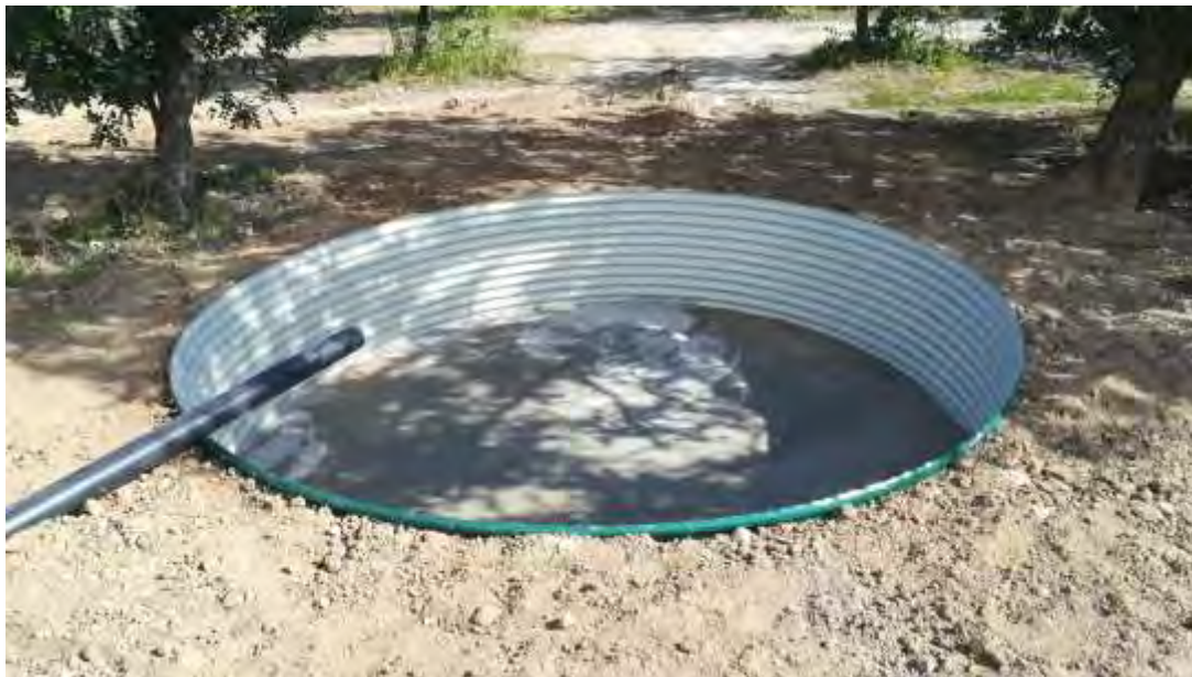
Foto nº 13. Aforador circular al aire libre con 9.000 litros de capacidad de recogida de drenajes, con solera de hormigón (29/11/2021).