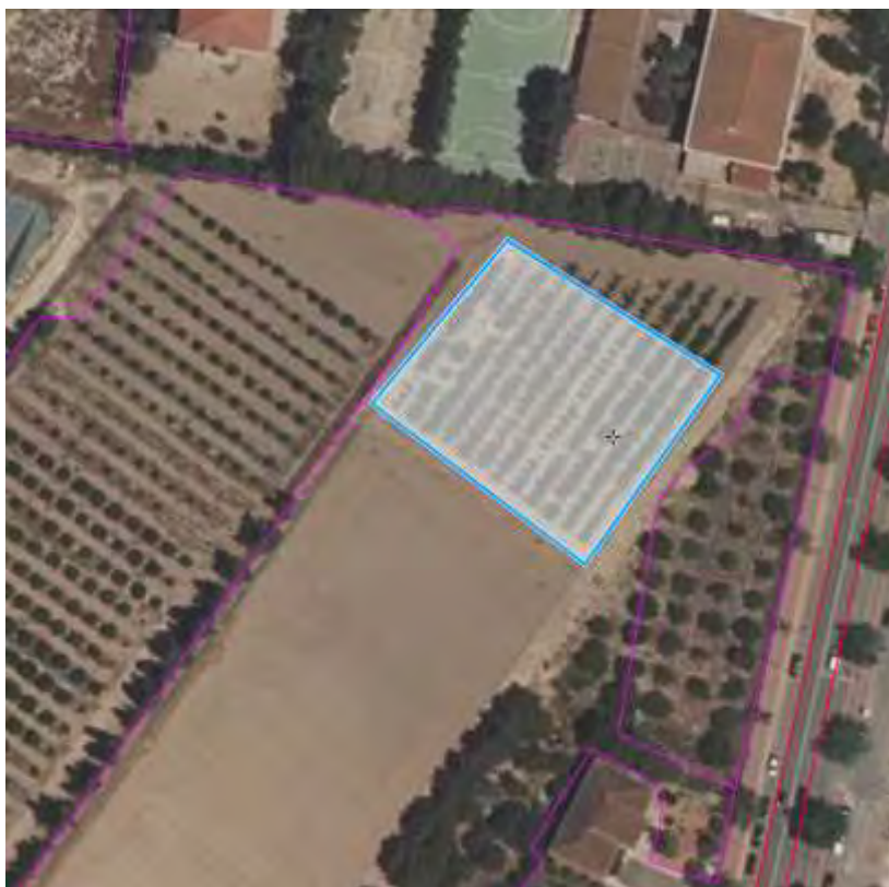
Foto nº 1. Ortofoto con ubicación en el CIFEA de la parcela dedicada a escorrentía.

Por motivos de diseño hubo que cambiar la ubicación, siendo la superficie final resultante la misma. El proyecto está ubicado en el CIFEA de Torre-Pacheco, según ortofoto adjunta: