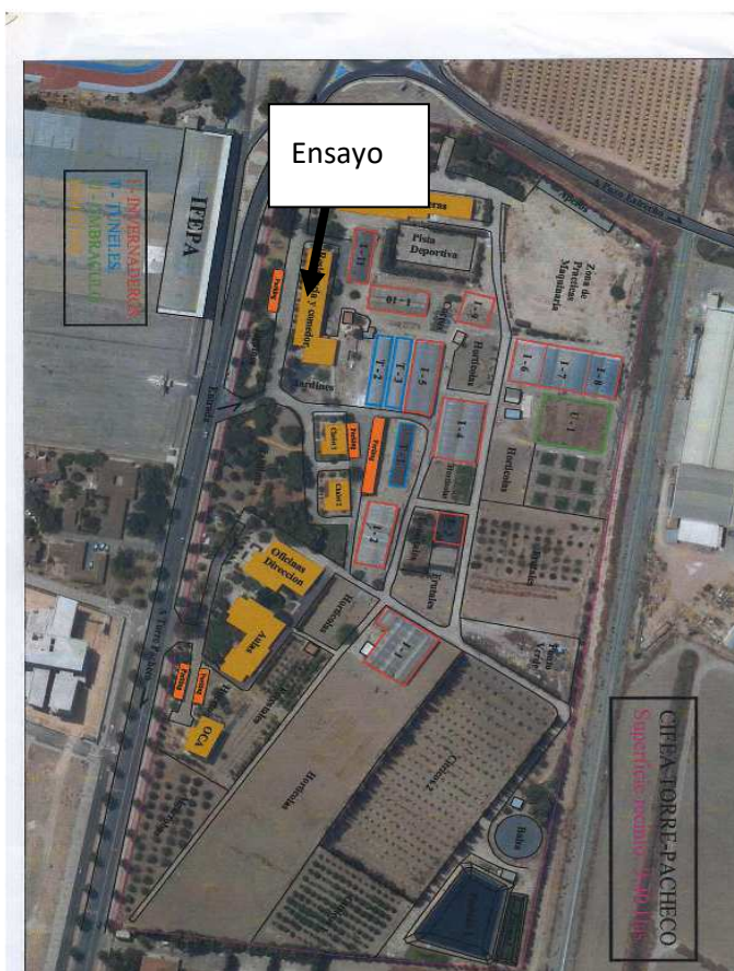
Figura 1: Plano del CIFEA de Torre Pacheco

La referencia del SIGPAC del CIFEA, es Polígono 19 parcela 9000, en la que engloba una gran cantidad de terreno, en la que está el CIFEA.