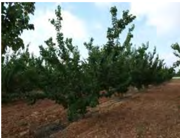
Albaricoqueros tardíos en finca Las Nogueras.

El cultivo del albaricoquero tiene una zona de desarrollo restringida, principalmente por el frío, aunque es capaz de soportar el frío invernal, sus yemas, flores y frutos son sensibles a éste, factor que limita su cultivo en zonas templadas o frías como el noroeste murciano, donde se cultivan variedades de recolección medio-tardías para evitar los daños de heladas y sacar producciones fuera del periodo de comercialización de la mayor parte de la Región.