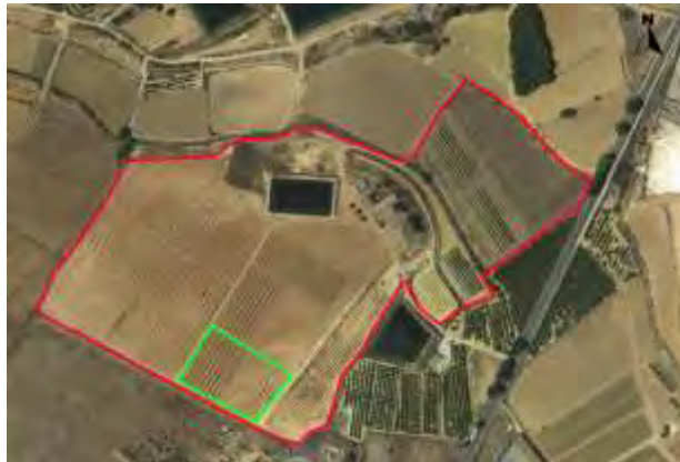
Ubicación de los albaricoqueros.

Se encuentra situado en el extremo Sur de la Finca, junto a los granados, cerezos y pistachos, pequeña parcela con coordenadas UTM-Huso 30 (ETRS-89); 595.749/4.210.677 en la finca denominada Las Nogueras de Arriba, propiedad de la Comunidad Autónoma de la Región de Murcia, catastralmente en la parcela 385 del polígono 129 en el paraje Los Prados, Caravaca de la Cruz.