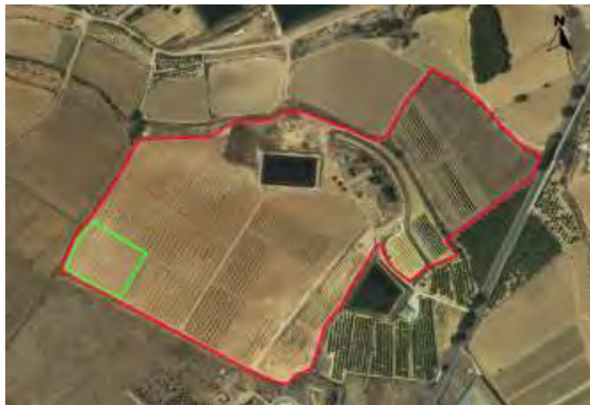
Croquis de Ubicación de la parcela de quercus y trufa en el CDA Las Nogueras.

La superficie de la parcela demostrativa dentro del proyecto es 0,70 has.