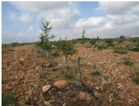
Riego por aspersión quercus-trufa.

De la totalidad de cultivo se encuentran en secano 0,18 ha y con apoyo de riego por aspersión programado en los meses de mayo a octubre 0,47 ha. Los aspersores están colocados en la línea de plantación, a 1 aspersor por árbol. El riego de apoyo tiene como fin salvar la estación seca y que el cultivo simbiótico pueda continuar y completar su ciclo durante el otoño y el invierno.