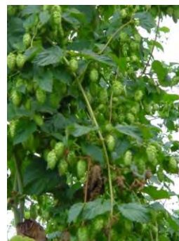
Flores femenina de lúpulo.

Se trata de una especie dioica, es decir, que las plantas masculinas y las femeninas son en pies separados. El aprovechamiento del cultivo es exclusivamente de las flores femeninas y habrá que evitar la presencia cercana de pies masculinos que puedan llegar a polinizarlas y depreciar así su calidad industrial.