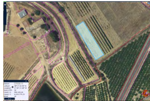
Croquis de ubicación de la parcela de lúpulo en el CDA La Nogueras de Arriba.

La superficie total de la parcela demostrativa dentro del proyecto es de unos 2.000 m 2 , de los que el entutorado ocupa 1.675 m 2