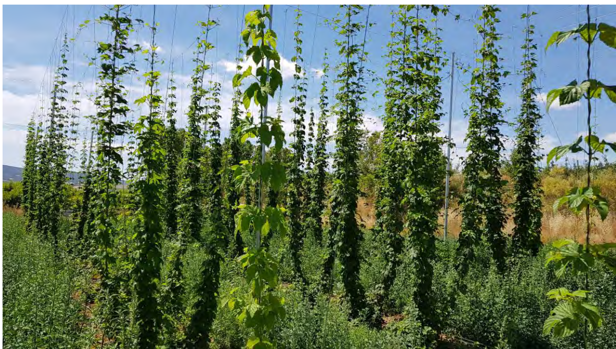
Plantación entutorada de lúpulo en el CDA Las Nogueras de Arriba.

La UE es el mayor productor mundial de lúpulo y dentro de ésta, con una producción media en los últimos cinco años de unas 49 mil toneladas, destaca Alemania como principal productor comunitario y mundial con más del 70% de la producción comunitaria, seguido de la República Checa, Polonia, Eslovenia y España.