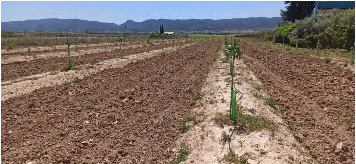
Fotografía 3: Vista parcela