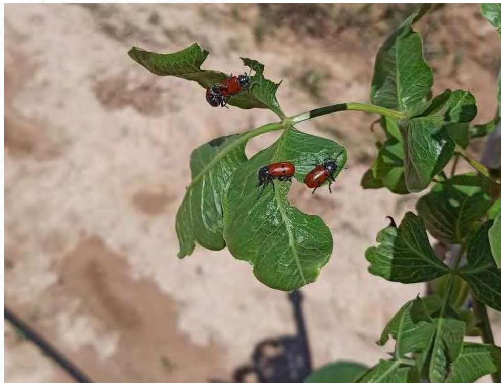
Fotografía 2: Detalle del coleóptero Posiblemente Lachania sp.