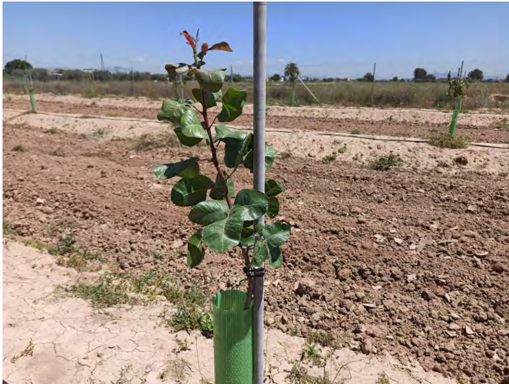
Fotografía 1: Crecimiento variedad Advat