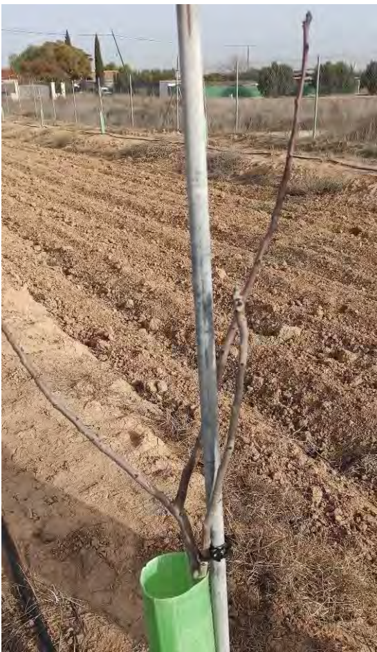
Fotografía 4: Caída hoja